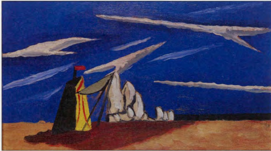
JEAN LURÇAT LANDSCHAP, 1930 OLIEVERF OP DOEK 24 X 41 CM