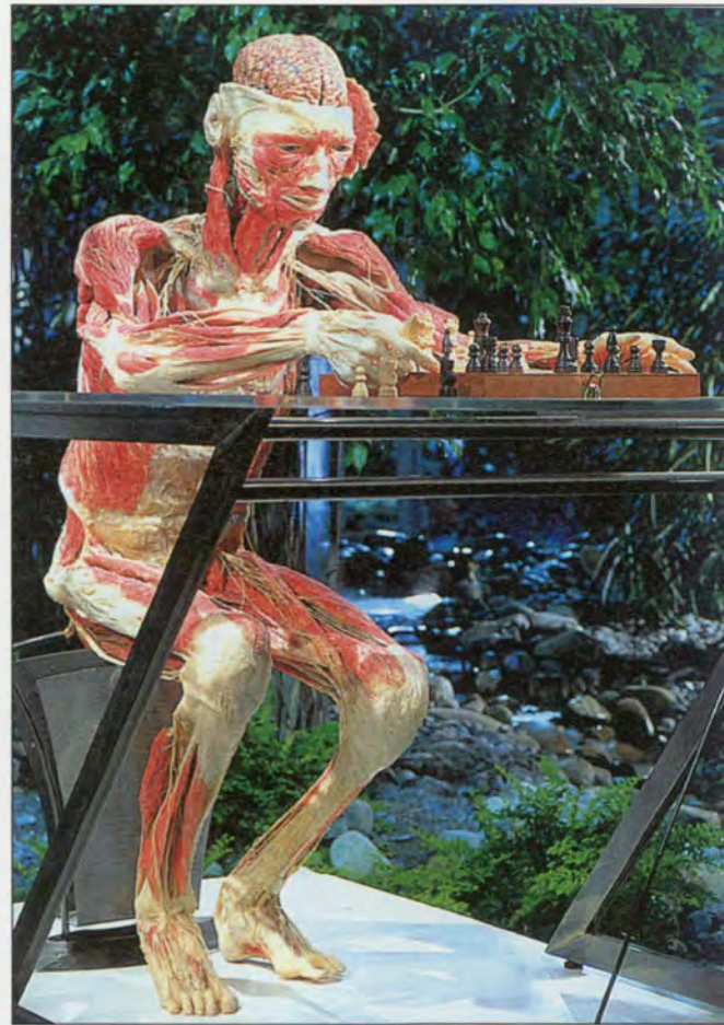
DE SCHAKER

Zo kan je naast de kast met de levercirrose-plastinaten het bordje zien staan dat je de richting van de bar weergeeft! Humor, ongetwijfeld!