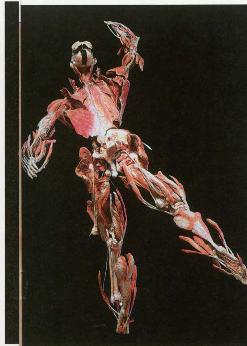
DE HARDLOPER © FOTO INSTITUUT VOOR PLASTINATIE, HEIDELBERG SIAMESE TWEELING © FOTO INSTITUUT VOOR PLASTINATIE, HEIDELBERG

Als de man dan nog citaten van bezoekers in de catalogus opneemt om zijn 'kritische' zin te tonen, en je leest: 'Waarom zijn er geen plastinaten van de coïtus te zien, hoe moet ik hier mijn kinderen voorlichten?', dan kan je daar op zijn minst zware bedenkingen bij hebben. Ook bij die bezoekers trouwens.