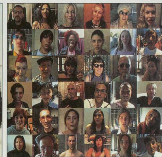
OLIVERA CAPARA/SHOW ANTWERP