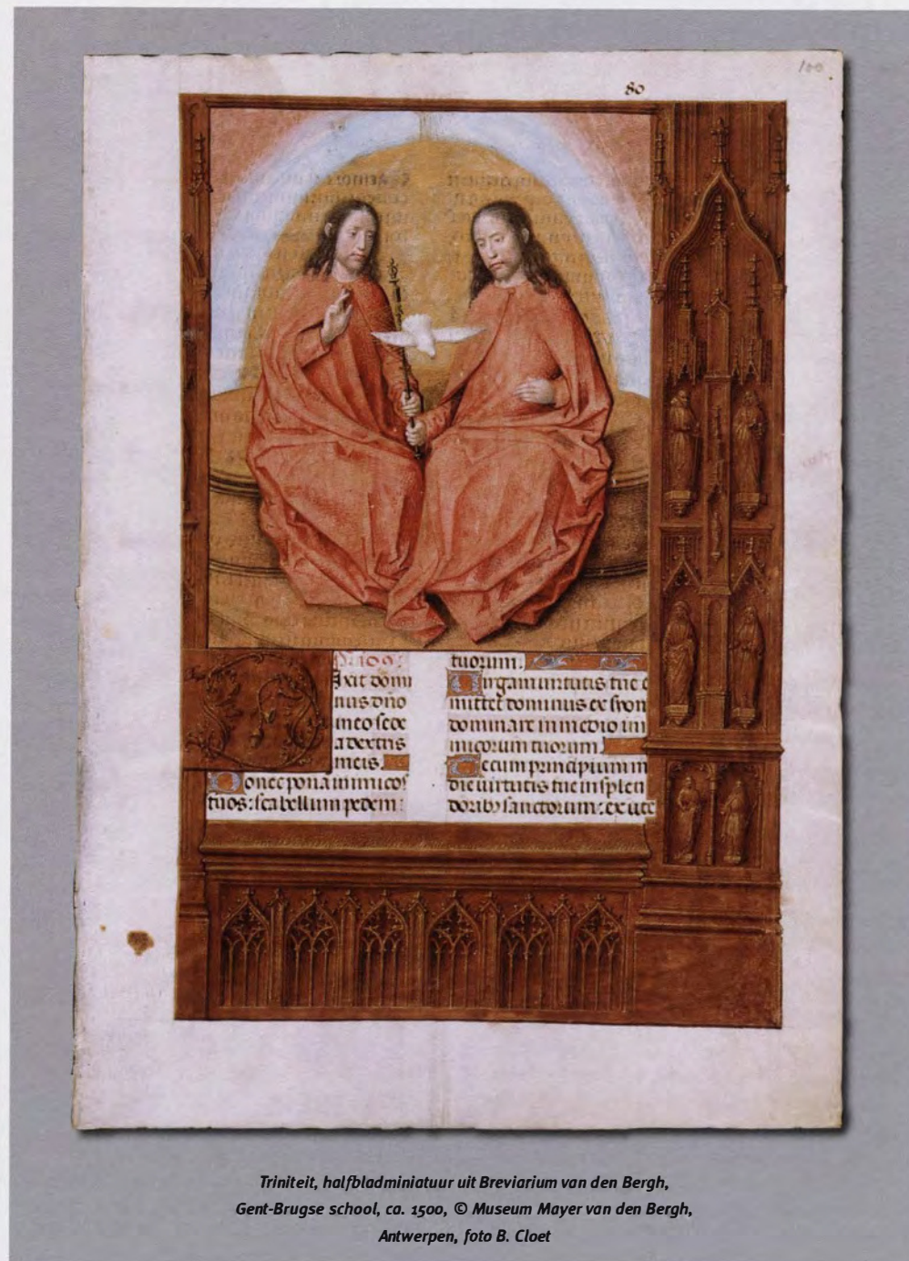
Triniteit, halfbladminiatur uit Breviarium van den Bergh, Gent-Brugse school, ca. 1500, © Museum Mayer van den Bergh, Antwerpen, foto B. Cloet

viarium, dat rijk verlucht werd door Gents-Brugse miniaturisten, betaalde de kieskeurige verzamelaar de hoogste prijs van al zijn kunstwerken. Het kostte dus nog meer dan Pieter Breughels 'Dulle Griet', die ook tot de pronkstukken van de collectie behoort. Het museum viert het eeuwfeest met een expositie van de belangrijkste bladen uit het gebedenboek, die – in afwachting van een soepelere band – apart kunnen bewonderd worden. Bovendien zijn alle miniaturen