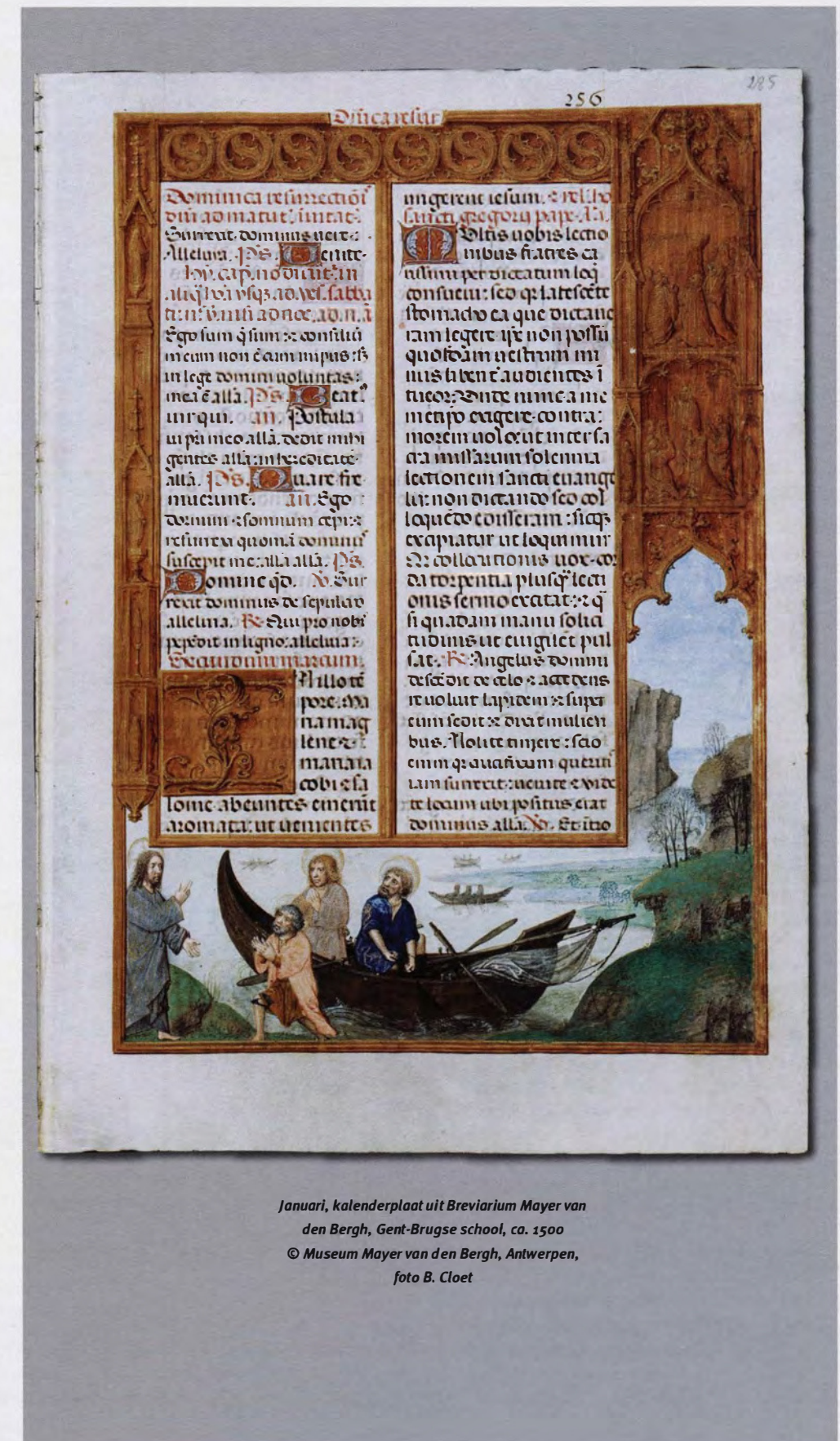
Januari, kalenderplaat uit Breviarium Mayer van den Bergh, Gent-Brugse school, ca. 1500

Dekeyzer: "In principe bestaat dit soort gebedenboeken uit vijf luiken. Het 'temporale', dat alle officies voor de zon-, feest- en wekdagen van het kerkelijk jaar omvat, is het belangrijkste deel. De teksten zijn vanaf de eerste zondag van de Advent, als het kerkelijk jaar begint, chronologisch geordend. In het 'Proprium sanctorum' is voor elke heilige een apart gebed voorzien. Het 'Commune sanctorum' bevat daarentegen gebeden, die voor alle heiligen bruikbaar waren. Een kalender en een Psalterium of psalmenboek maken een brevier compleet. De maanden in het kalendergedeelte van het Breviarium Mayer van den Bergh zijn bovenaan versierd