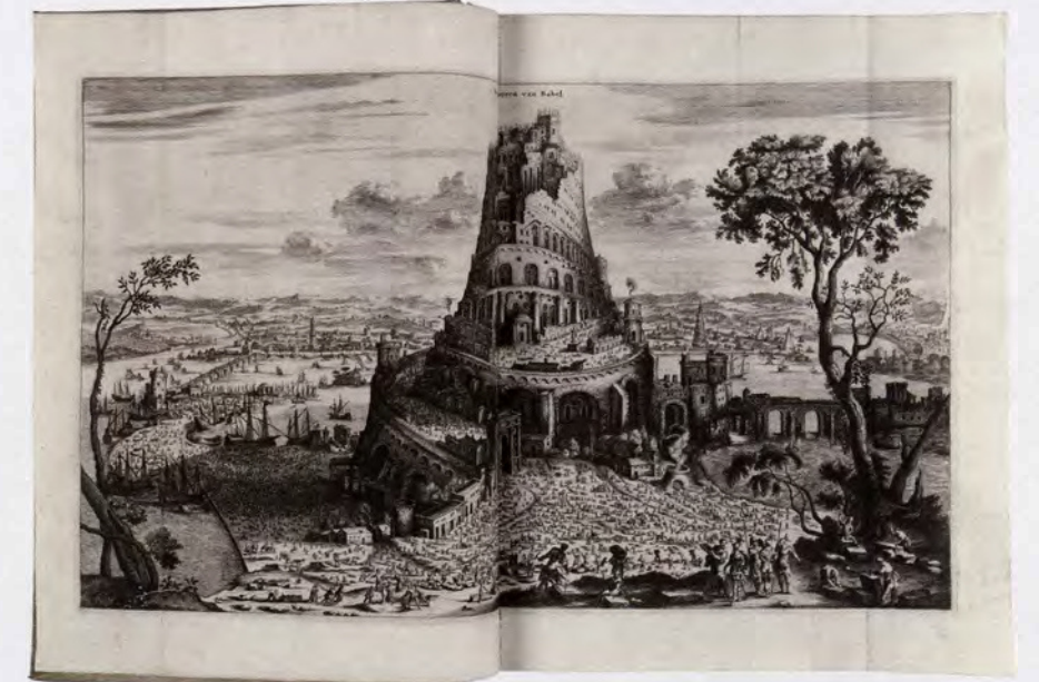
babel, Olfert dapper, Naukeurige Beschryving van Asië, Amsterdam, Jacob Van Meurs, 1680

Binnen dat rijtje bekleedt Westmalle een enigszins aparte plaats: het is een creatie uit de negentiende eeuw. De collectie volgt echter hetzelfde patroon als de andere abdijen die aanzienlijk ouder zijn en reeds een patrimonium hadden.