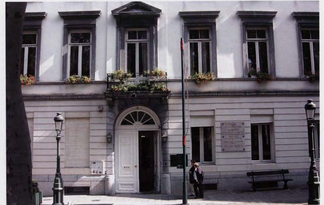
Het Charliermuseum aan de Kunstlaan. Wat was er eerst?