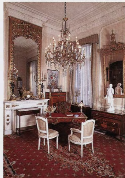
Het Salon Lodewijk XVI. Smaak en verfijning waren de ordewoorden.

Om de haverklap vinden in het Charlier Museum colloquia, ontmoetingen, jazznamiddagen, en allerhande multiculturele bijeenkomsten plaats. Het museum is dan ook geen slapend oord maar wil door het scheppen van tal van initiatieven ervoor waken dat het museum zijn maatschappelijk georiënteerde en intellectuele opdracht niet uit het oog verliest, precies zoals Van Cutsem het had gewenst.