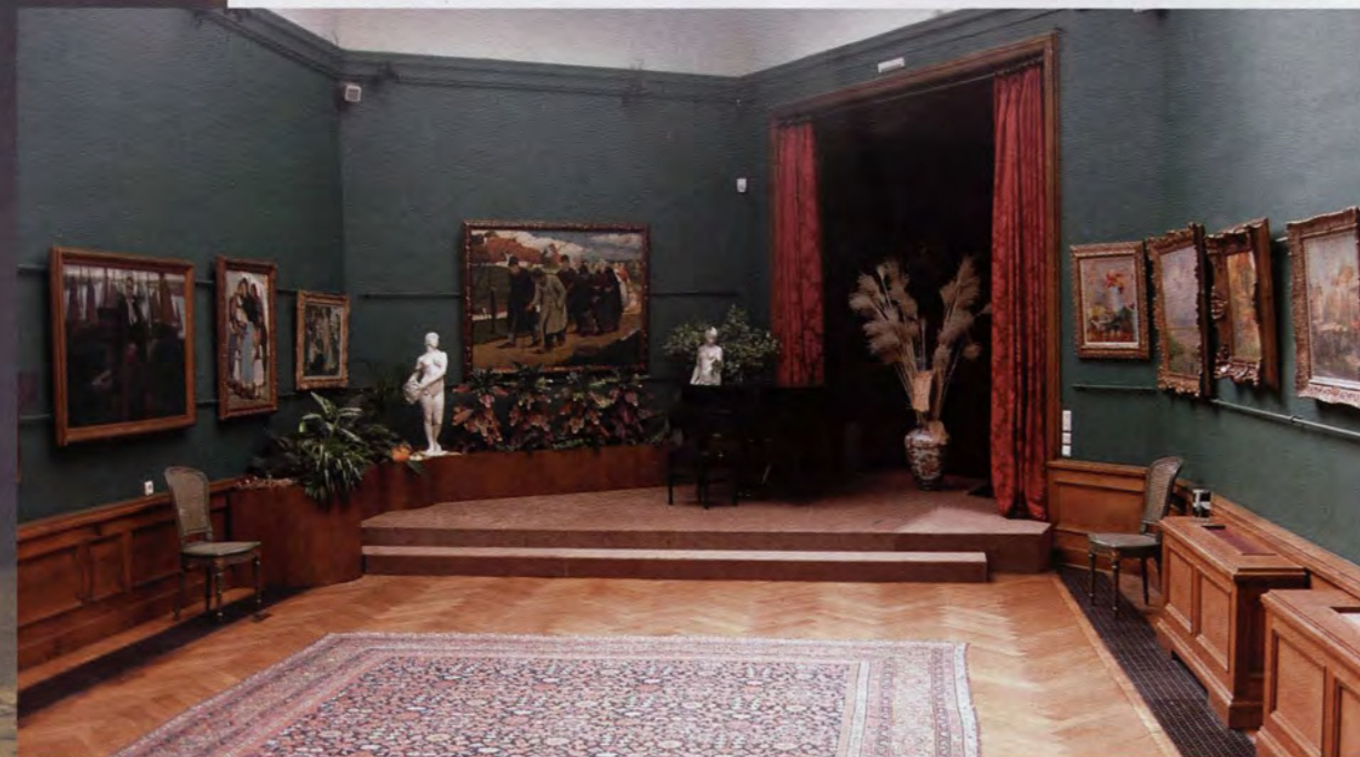
De schilderijgalerij vandaag.