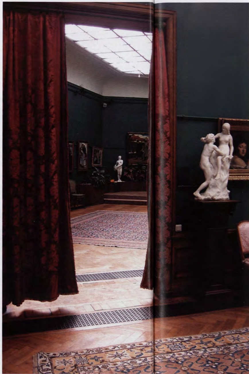
Iedereen was welkom maar discretie troef.

sem en vervulde die met kunstwerken van Van Zevenberghen, Oleffe en Heymans, zeg maar de postimpressionisten.