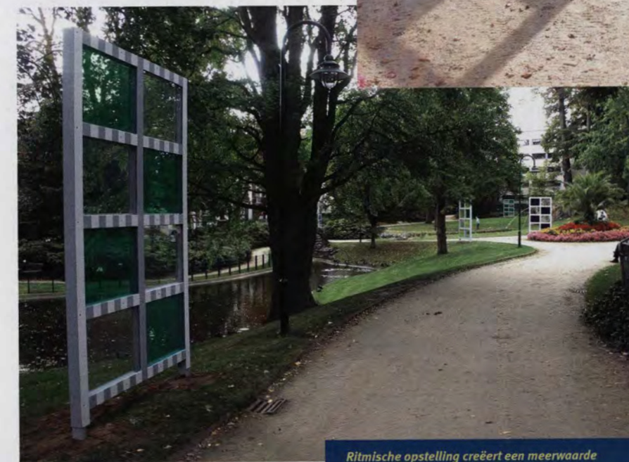
Ritmische opstelling creëert een meerwaarde

ruimtes. Op straten, pleinen en metrostations verfdde hij talloze gelijkmatig verdeelde witte strepen. Toen hij in 1971 in het New Yorkse Guggenheimmuseum de klassieke museumarchitectuur en de lineaire opstelling van de geëxposeerde werken hekelde door in de centrale hal een gigantische lap gestreepte stof op te hangen, kreeg hij weliswaar veel kritiek van zijn collega's te verduren, maar was zijn naam gemaakt. Nadat hij voor de eretuin van het Palais Royal in Parijs tweehonderdzesig zwart-wit gestreepte zuilen van verschillende lengte had ontworpen, werd hij overladen met opdrachten. Meestal om openbare ruimtes met zijn minimalistische kunst, die hij 'objectief' en 'neutraal' noemt, op te vrolijken.