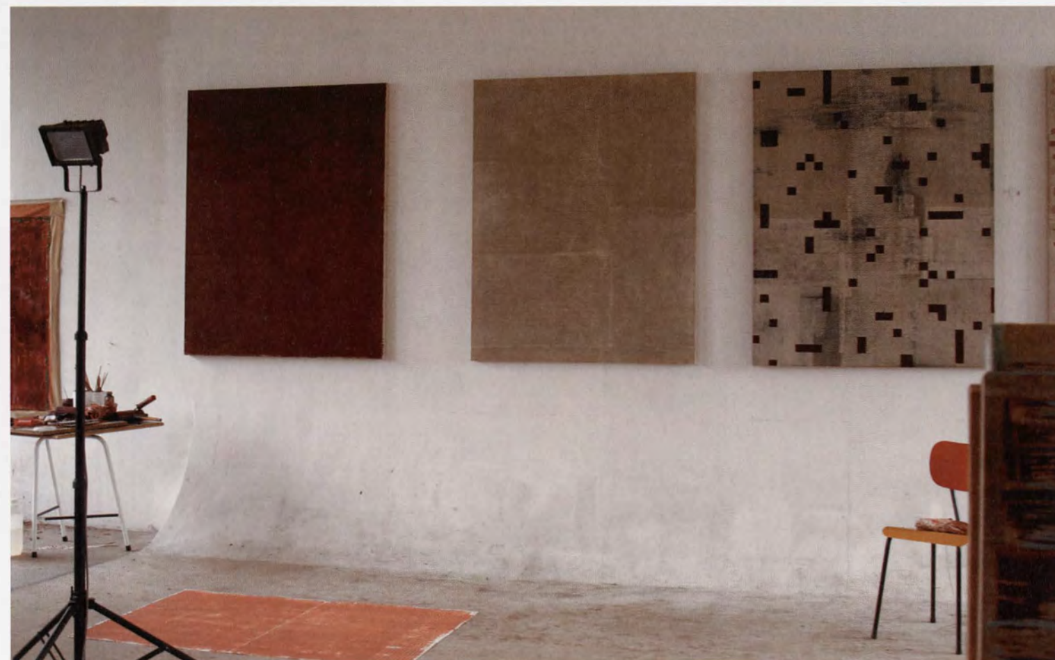
Ateliervan Dirk Vander Eecken

De ruimten van het in de kunstwereld wat miskende Elzenveld zijn bijzonder geschikt om kunst te tonen en deden het werk van Dirk dan ook alle recht.