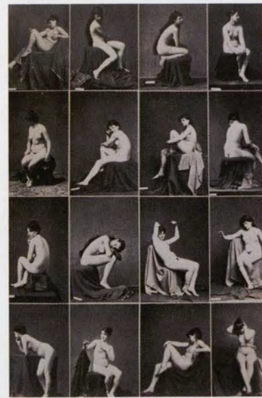
Louis Igout, Attitudenplank: vrouwen, 1880, 205 x 135

Het is reeds uitvoerig getoond en beschreven hoe Fernand Khnopff (1858-1921) voor het realiseren van enkele van zijn merkwaardige symbolistische schilderijen een beroep deed op fotografisch materiaal. Memoires van 1889 is wellicht het werk waarin de inspirerende waarde die door de kunstenaar aan de fotografie werd toegekend het sterkst naar voren komt. Op basis van een zevental poses die Khnopff van zijn zuster Marguerite ontscheurde en op de gevoelige plaat vastlegde, construeerde hij een totaalbeeld, waarin de verschillende houdingen van het model door de geschaakte lichtinvallen tot een grote compositie werden verenigd.