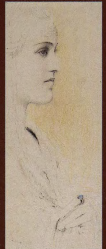
Fernand KHNOPFF (1858 - 1921), De slaier (detail) potlood en kleurpotlood op papier, 183 x 105 mm

dinsdag tot zaterdag van 10u30 tot 18u30