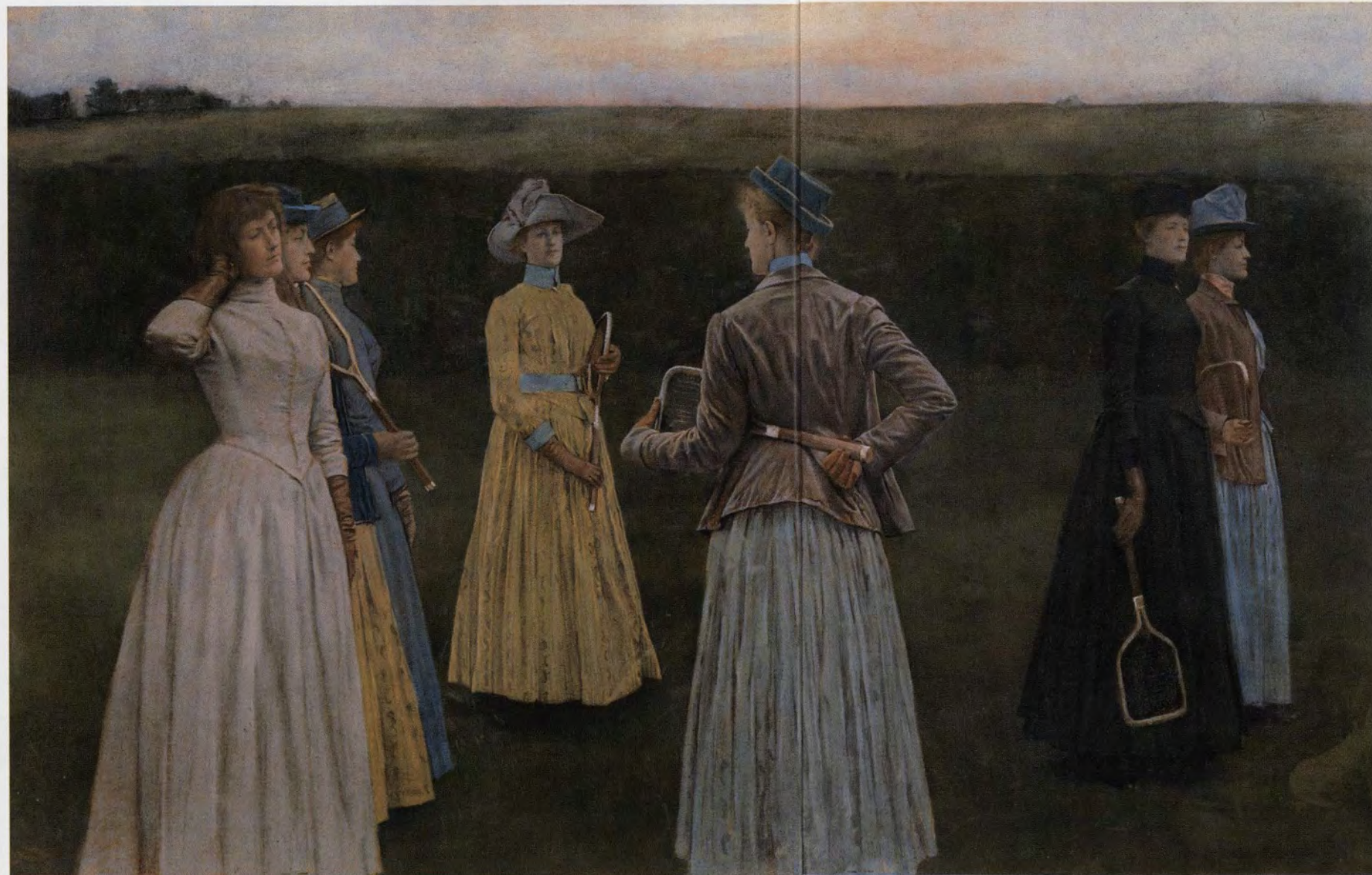
Fernand Khnopff, Memoires, 1889, Koninklijke Musea voor Schone Kunsten van België

In de rand van de grote retrospectieve tentoonstelling Fernand Khnopff in het Museum voor Oude Kunst te Brussel realiseert het Paleis voor Schone Kunsten een merkwaardig opzet onder de titel: 'Rond het symbolisme. Fotografie en schilderkunst in de negentiende eeuw'.