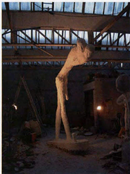
Boetseren in het atelier te Oudenaarde

Of, zoals te lezen is over SelfSelf , zijn recente tentoonstelling in het SMAK: “Vanuit zijn verbeelding en emotionele ervaring creëert Tahon een beeld dat hij noodgedwongen moet maken.”