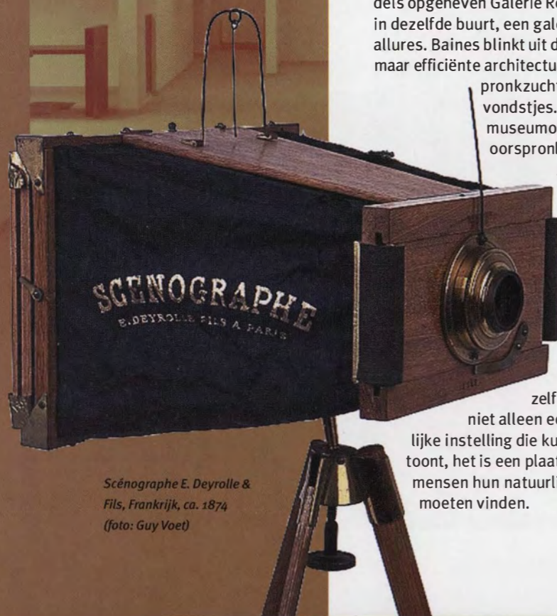
Scénographe E. Deyrolle & Fils, Frankrijk, ca. 1874