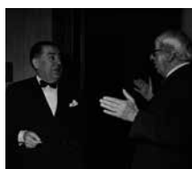
fig. 5 financiële ondersteuning van de bevriende kunstenaar Fernand, van wie hij honderden schilderijen, tekeningen en sculpturen bezat, en was hij verantwoordelijk voor de internationale doorbraak van Antoine Martini (via house painter belge). De weinige eigentijdse bronnen interpreteren het selectieve van de collectie Van Geluwe als een teken van zijn generositeit ten aanzien van jonge kunstenaars.