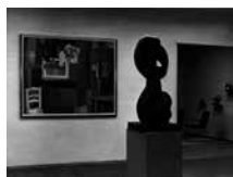
fig. 6 Van Geluwe was daarnaast lid van het comité voor moderne kunst van de Koninklijke Musea voor Schone Kunsten van België en werd vanaf 1959 lid van het afdelingscomité van het Provinciale Museum voor Moderne Kunst in Oostende. De verzamelaar had met zijn enorme netwerk een grote invloed op de toenmalige kunstwereld. Zo zorgde hij ervoor dat jonge kunstenaars aan de slag konden, verliet hij vrienden aan een kunst te verzamelen en was hij een cruciale schakel binnen het netwerk van de Belgische kunstwereld van de jaren 1950 en de vroege jaren 1960.