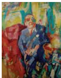
fig. 4 In de jaren 1950 bestond, werd verschillende malen als eedwettig beschreven. Zowel getrouwen als ongetrouwen kunstenaars waren er in terug te vinden. Van Geluwe wilde geen collectie opbouwen die een coherent geheel vormde, maar verzamelde om kunstenaars aan te moedigen en te behouden, ongeacht het feit dat hij op die manier verlies maakte. Zo zorgde hij voor de