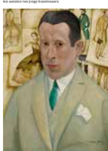
fig. 7 De weinige bronnen interpreteren het selectieve van de collectie Van Geluwe als een teken van zijn generositeit ten aanzien van jonge kunstenaars.