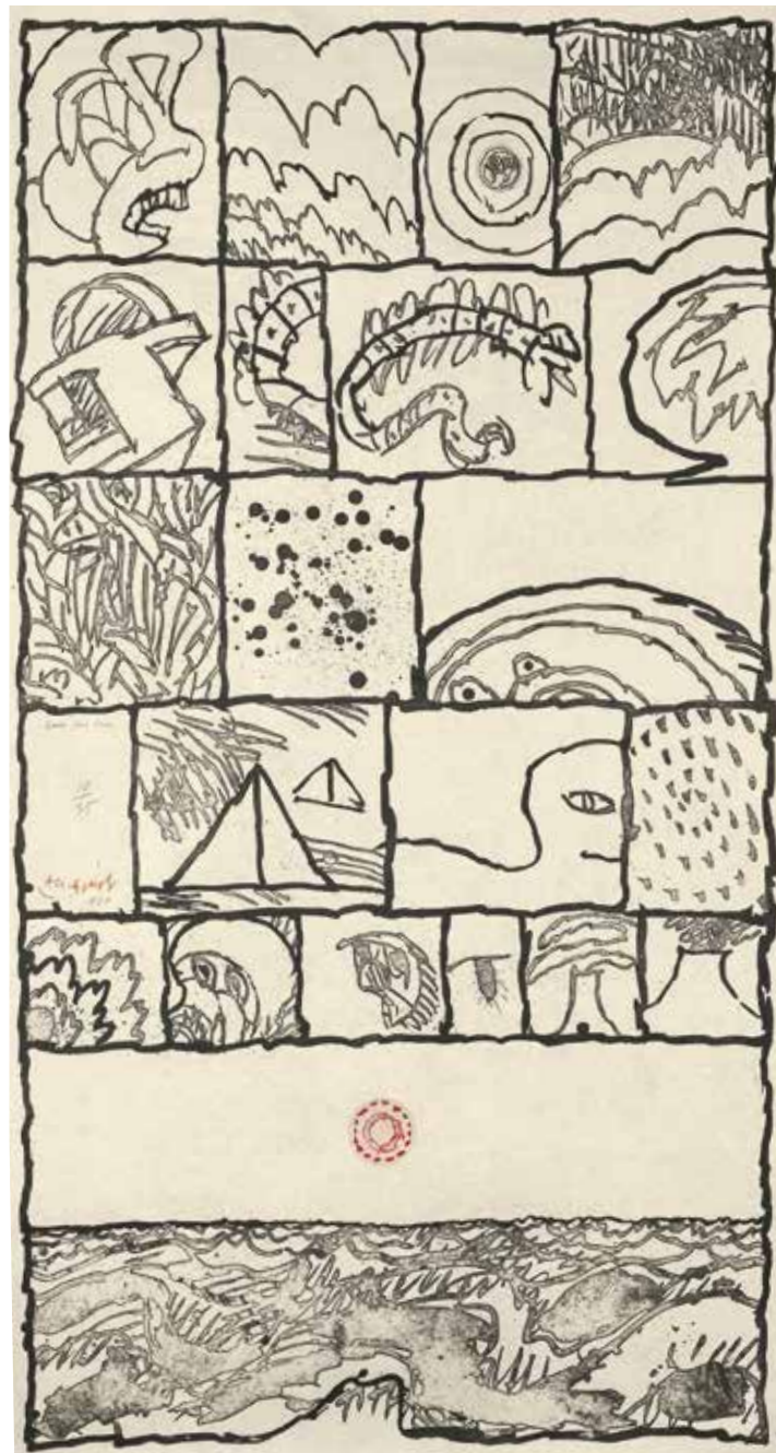
Pierre Alechinsky, Case par case , 1980, steendruk en kleurets op Japans papier, 1.708 x 925 mm