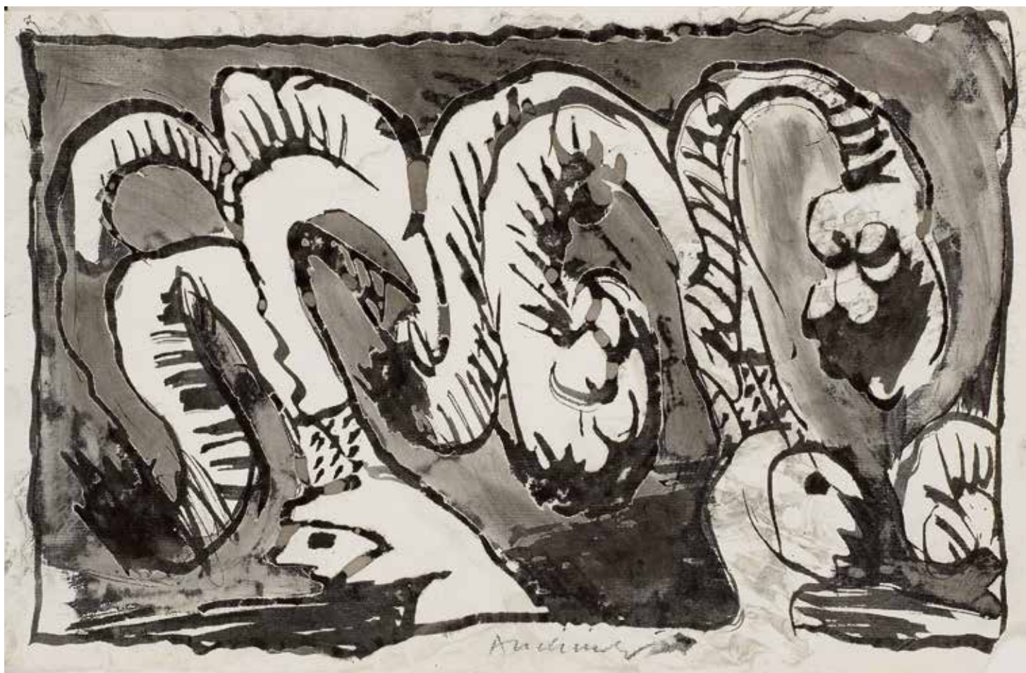
Pierre Alechinsky, Wat Binche betreft , 1967, Oost-Indische inkt, gewassen, op oud vergépapier, 245 x 320 mm Schenking van de kunstenaar, 1973 Koninklijke Musea voor Schone Kunsten van België, Brussel © KMSKB, Brussel / Courtesy of the artist / Foto: Grafisch Buro Lefevre, Heule

Eenvoudig toch? Pierre Alechinsky is altijd en exclusief bezig met het moment. Het is niet uit te sluiten dat hij het recept van de eeuwige jeugd gevonden heeft. RIK SAUWEN