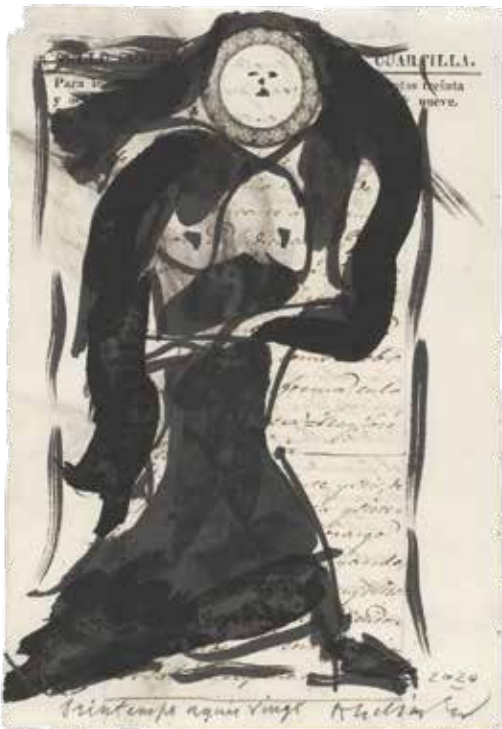
Pierre Alechinsky, Printemps année vingt , 2020, Oost-Indische inkt, gewassen op een negentiende-eeuwse Spaanse registerpagina, 316 x 216 mm Schenking van de kunstenaar, 2020 Koninklijke Musea voor Schone Kunsten van België, Brussel © KMSKB, Brussel / Courtesy of the artist / Foto: J. Geleyns - Art Photography

Carta canta. Het papier van Alechinsky is nog lang niet uitgezongen. Volgens de kunstenaar kan het eigenlijk alleen maar gemakkelijker worden voor hem. Het leven heeft hem geleerd