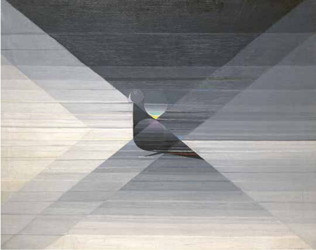
Felix De Boeck Felix, De duif , 1927, olieverf op doek, 73 x 90 cm COLLECTIE MUSEUM VAN ELSENE