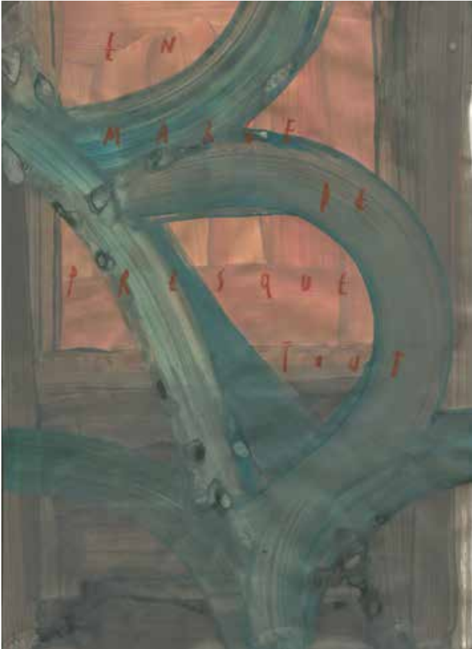
Arpaïs Du Bois, En marge de presque tout , 2020, mixed media op papier, 25 x 18,5 cm