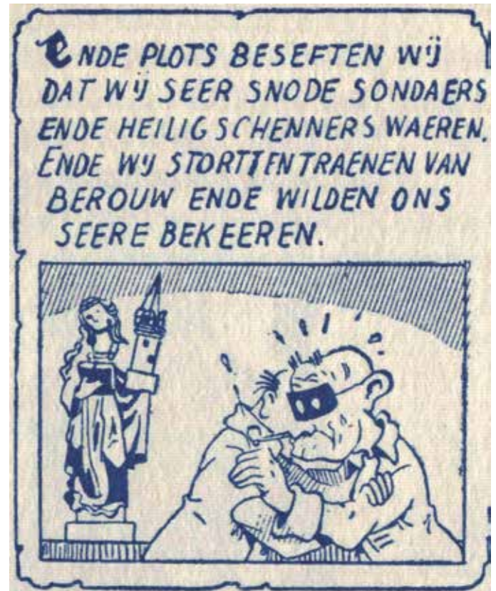
Willy Vandersteen De avonturen van Suske en Wiske, De Bokkerijder (voorpublicatie in krant 1948) © DE STANDAARD UITGEVERIJ 2020