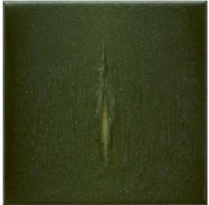
Charlie De Voet, Dissection , 2015, olieverf op doek, 20 x 20 cm

Het is niet te verwonderen dat de werken van Charlie De Voet in al hun abstractie een zekere sacraliteit over zich hebben. Ze roepen een mysterie op dat, zoals het hoort, niet te doorgronden valt. Zijn ingreep in het kapelletje langs de weg in Zwalm was dan ook subliem en bijzonder raak. Hij had er niet enkel een bijzonder schilderij aangebracht, hij had er ook voor gezorgd dat de linden die daar stonden in een vierkant waren gesnoeid, wat de plek nog meer uitstraling en kracht meegaf. Charlie De Voet liet de jongste tijd ook andersoortig werk zien. Hij toonde de verfhuid zelf. “Dat is eigenlijk organisch gegroeid vanuit mislukkingen. Van werken die helemaal dichtgeverfd waren, pelde ik de verf af en gooide die weg zodat ik het doek opnieuw kon gebruiken. Later groeide de idee om die vellen te recyclen. Ik bracht ze aan op ongeprepareerd canvas zodat er een schilderij op het schilderij ontstond en stilaan is dat schilderij dan meer sculpturaal geworden.”