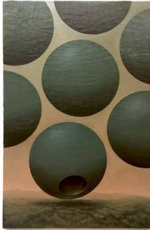
Charlie De Voet, Landscape With Inner Space , 2019, olieverf op doek, 164 x 106 cm

Naast het experimenteren met verf en verfhuide, gaat Charlie De Voet verder met het maken van monochromen die dus eigenlijk geen monochromen zijn. Hij maakt ze in diverse formaten en wat opvalt is dat zijn kleurenpalet bij het ouder worden iets meer helder en lichter is geworden. Hij heeft duidelijk zijn weg gevonden. Naast de pure abstractie komen er ook motieven in zijn werk naar voor, zij het op eerder minimale wijze. Telkens weer gaat het om een combinatie van waarneming, verdieping en verbeelding. Landscape With Inner Space is daar een voorbeeld van. De schilderijen van Charlie De Voet laten steeds aan de toeschouwer de mogelijkheid om erin op te gaan, erin weg te dromen en te verdrinken zonder in ademnood te komen. Het zijn werken die zeer materieel zijn ontstaan, maar de materie totaal doen vergeten. Ze brengen de stilte in je binnen, een sacrale stilte.