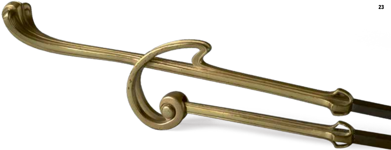
Victor Horta, vuurstang, ca. 1900 HORTAMUSEUM, SINT-GILLIS (BRUSSEL)

verwant met de symbolistische lyriek van de Franse art nouveau. Hij vat het motto van zijn kunstenaarsvereniging Les Nabis in 1890 treffend samen in de welbekende zin: “Bedenk dat een schilderij, voordat het een krijgspaard, een vrouwelijk naakt of een genrescène is, in de eerste plaats een plat oppervlak is met kleuren in een bepaalde ordening.” In zijn behangontwerp kronkelen treinen als rupsen tussen zacht slingerende lijnen. De moderne maatschappij en een dromerige natuur versmelten in elkaar.