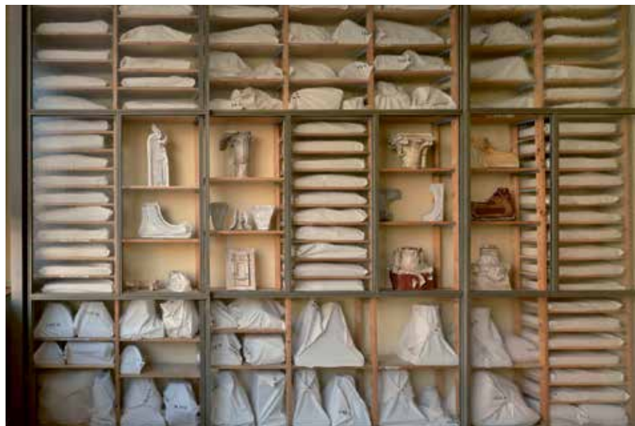
Wand van het voormalig tekenbureau