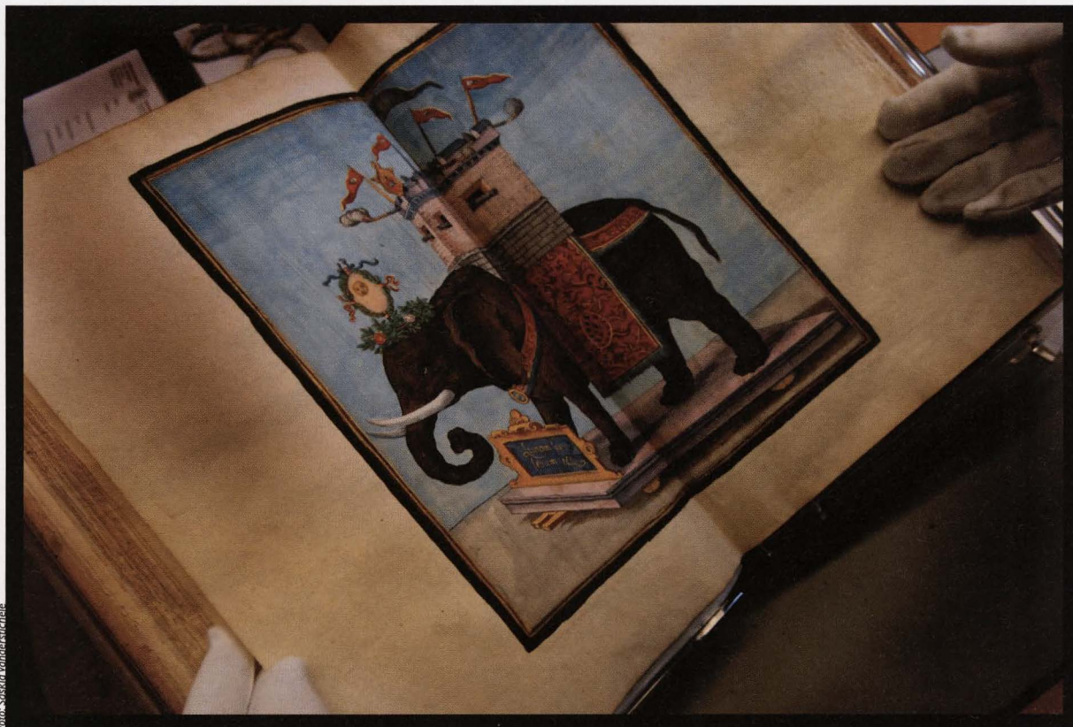
Onbekend, Olifant uit La joyeuse & magnifique Entrée de Monseigneur François, fils de France... , druk, 1582