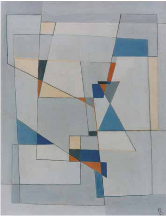
Kurt Lewy, Compositie 121 , 1953