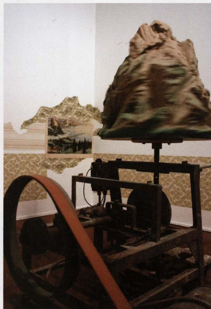
Parnassus, 2006, ongebakken klai