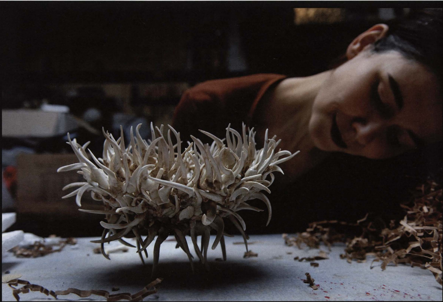
Medusa, 2005, porselein