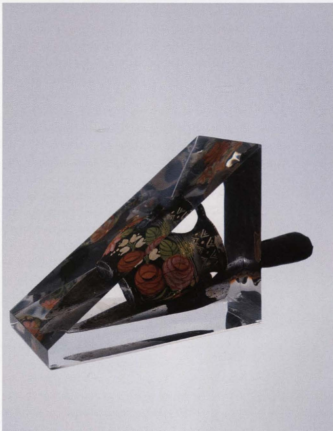
Objet Trouvé, 2001, keramiek, plexi en metaal, 23 x 14 x 14 cm