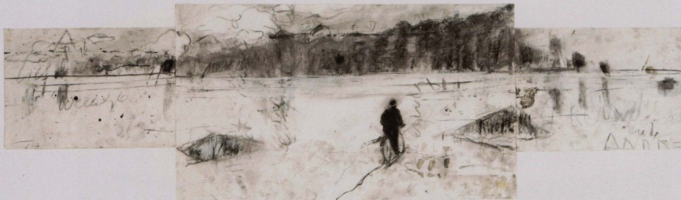
Methode, 2006, gemengde techniek op papier, 50 x 142 cm