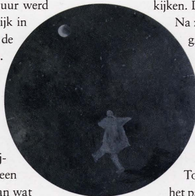
Dansant, 2006, olie op doek, diameter 120 cm

Hij gaat nooit op pad zonder schetsboek. Reizen, wandelingen en fietstochten zijn evenzeveel inspiratiebronnen, maar ook literatuur en muziek spelen een grote rol. Hij