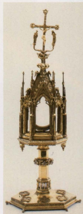
Het Stadsmus heeft de oudste nog bewaarde monstrans ter wereld

Links: Mirakelprent van de abdij van Herkenrode