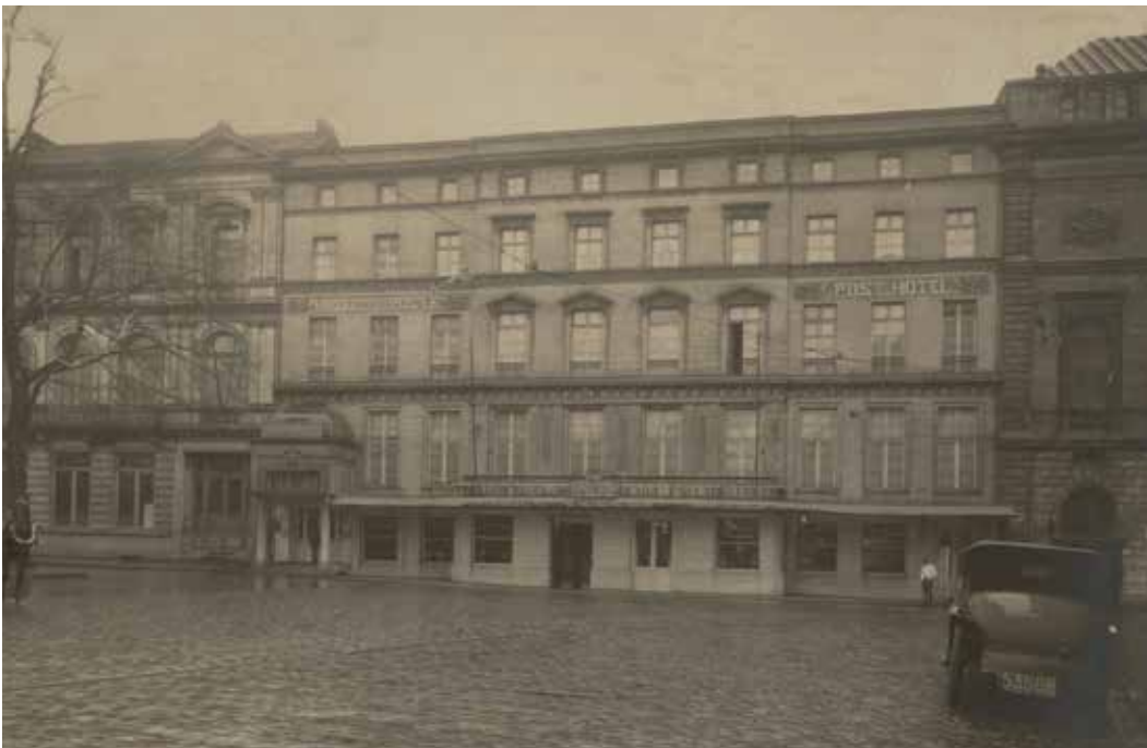
Het Posthotel in het begin van de twintigste eeuw ARCHIEF GENT, MA_SCMS_FO_3212

INFO De stadswandeling Op stap met Goetghebuer is gratis verkrijgbaar bij Visit Gent, Archief Gent en de Stadswinkel. Ook via de ErfgoedApp kun je deze wandeling maken. Het volstaat om de app op de smartphone te downloaden. De wandeling is ontwikkeld door Inge Misschaert, in samenwerking met Archief Gent en Gent on Files, de Vrienden van 't Archief. Wie lid wil worden van deze vereniging, betaalt 20 euro voor een jaar en ontvangt vier keer per jaar Archieflink, de nieuwsbrief van het GOF. Meer informatie vind je op https://gentonfiles.be of via gentonfiles@gmail.com . De Atlas Goetghebuer is raadpleegbaar in Archief Gent. De vernieuwde openingsuren: maandag, dinsdag, woensdag en vrijdag van 9 tot 13 uur en van 13.30 tot 16.30 uur. Donderdag, zaterdag en zondag gesloten. Info: archieff@stad.gent of T 09 266 57 34.