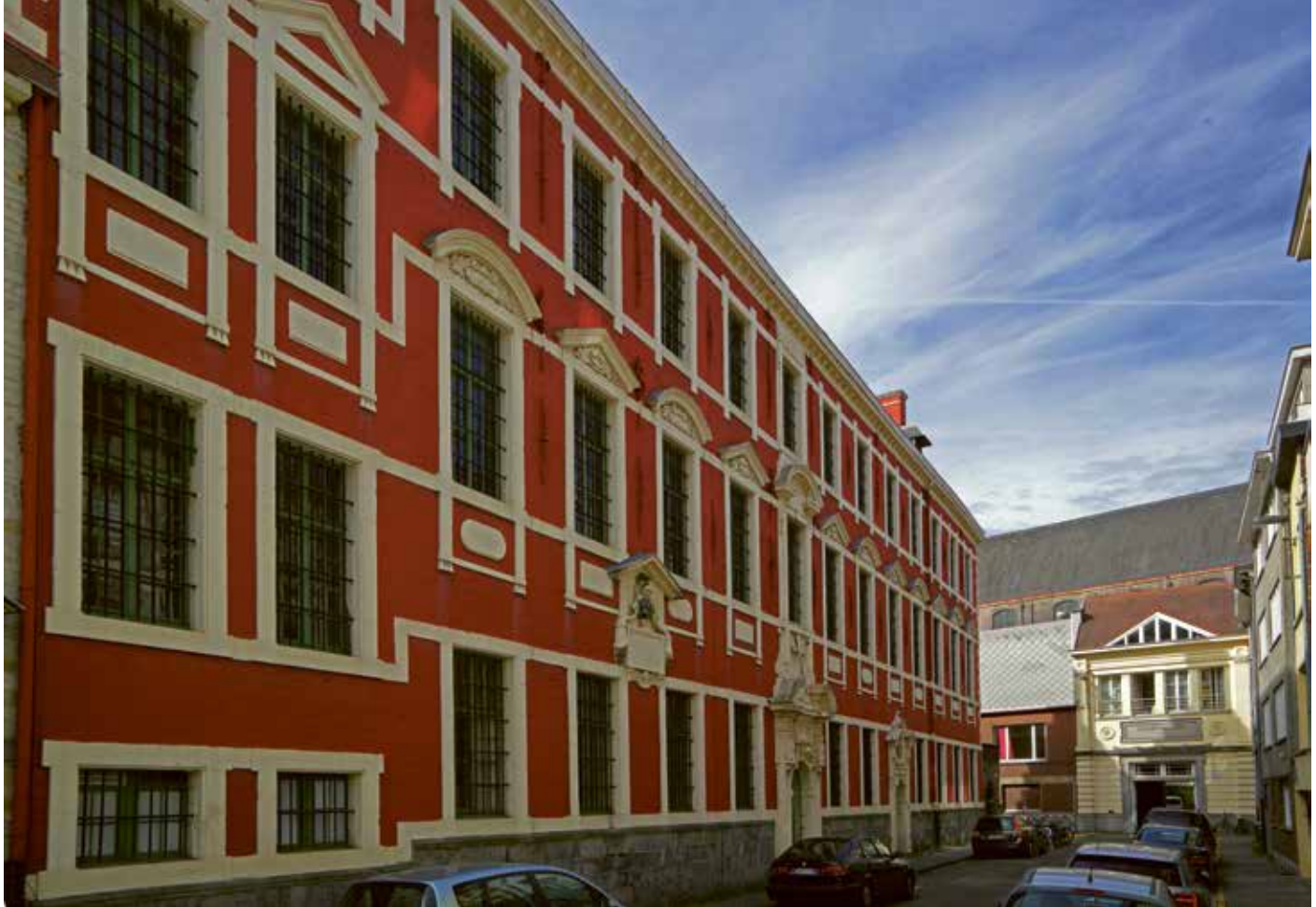
Berg van Barmhartigheid, waarin het stadsarchief Gent was gehuisvest tussen 1932 en 2005