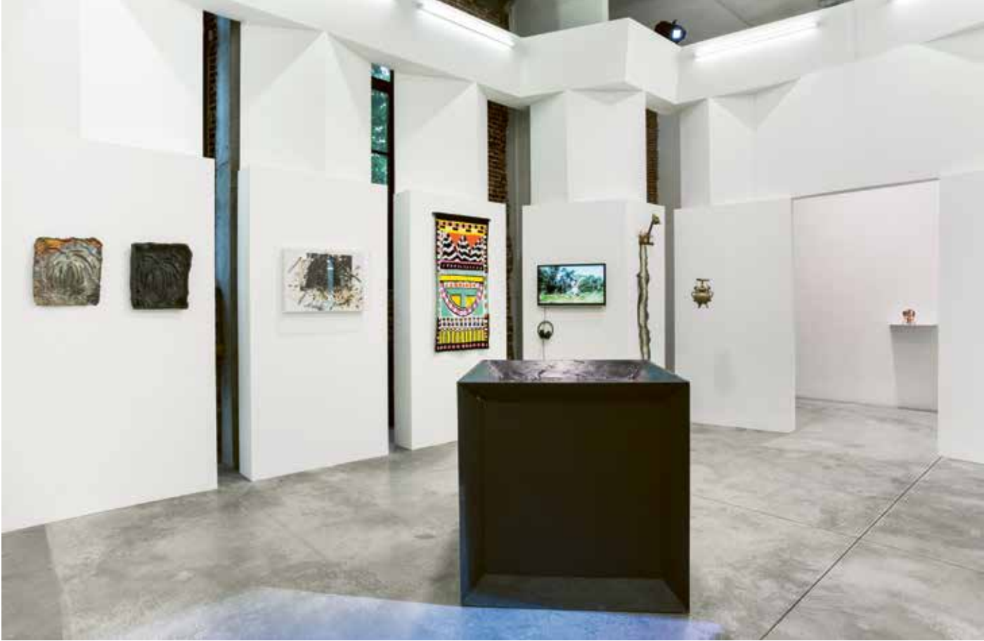
Zaalzicht Chapter One: Scripted Truths, 2020 AGPROGNOSTIC TEMPLE