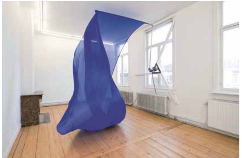
Zoro Feigl, Swell , 2020

NOMADISCH Dome Wood en Sam Steverlynck kiezen voor een model waar niet de kunstmarkt, maar de kunstbeleving centraal staat. The Agprognostic Temple is een nomadische kunst ruimte met een totaalconcept. Ze kiezen voor een witte modulaire tempelarchitectuur met in het midden The Cube of the Unknown . Deze zwarte kubus bevat bij iedere tentoonstelling een sleutelwerk, wat ze op de laatste dag ceremonieel onthullen. Wie financieel steunt, mag deelnemen aan een geheim inwijdingsritueel. Een bezoek aan The Agprognostic Temple is een ervaring die meerdere zintuigen aanspreekt. Mystiek, spiritualiteit en esoterie staan centraal. Tijdens de