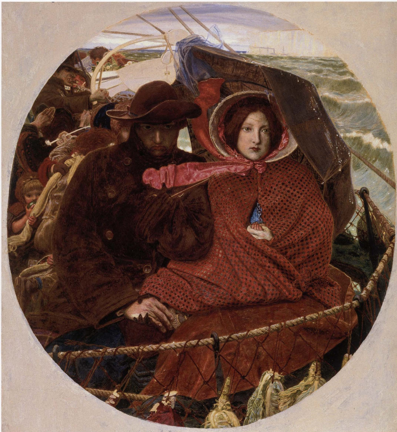
Ford Madox Brown, Een laatste blik op Engeland , 1860, olieverf op doek, 47,7 x 43,9 cm FITZWILLIAM MUSEUM, CAMBRIDGE