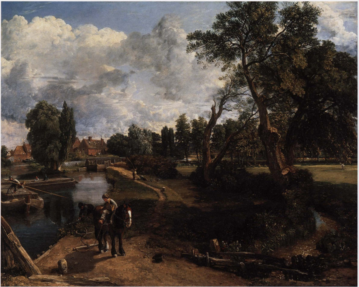
John Constable, Flatford Mill , 1817, olieverf op doek, 101,6 x 127 cm TATE, LONDEN

schillende maatschappelijke factoren; zoals de invloed van de industrialisering en verstedelijking; de ontwikkeling van grondbezit en landbouw en van het toerisme. Eén aspect van de Britse landschapschilderkunst, dat tot diep in de negentiende eeuw voortleefde, is de zogenaamde travel art , het reizen met als doel het vastleggen van bijzondere, vaak ideale landschappen. In de context van topografie en travel art kwam trouwens de Britse specialiteit van de aquarel tot ontwikkeling. De helderheid eigen aan het medium maakte de aquarel bijzonder geschikt voor het weergeven van kleur- en lichteffecten. Tot de grote aquarellisten hoorden vader en zoon Cozens, Francis Towne en Thomas Girtin. Joseph Mallord William Turner ging nog een stap verder in zijn nagenoeg abstracte colour beginnings . Tegelijk met de aquarel kwam ook de studie in olieverf tot ontwikkeling. Olieverfstudies waren vooral populair bij kunstenaars die in Italië werkten zoals de Welshman Thomas Jones. Een andere traditie binnen de Britse landschapschilderkunst zocht net het omgekeerde: het vastleggen van het