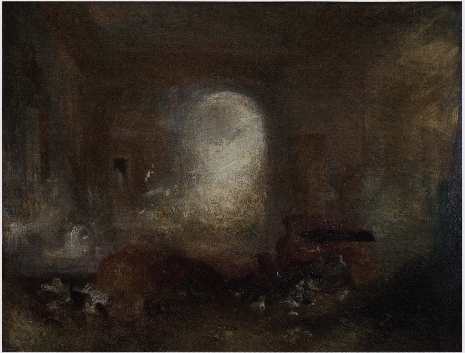
Joseph Mallord William Turner, Interieur van een landhuis; de salon van East Cowes Castle, ca. 1830, olieverf op doek, 90,8 x 121,9 cm TATE, LONDEN