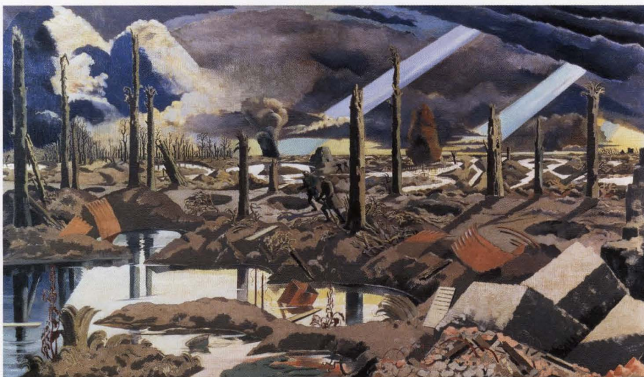
Paul Nash, De weg naar Menen , 1919, olieverf op doek, 182,8 x 317,5 cm IMPERIAL WAR MUSEUM, LONDEN