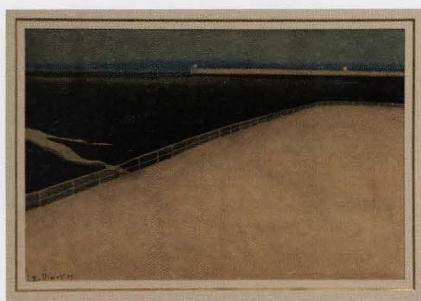
Leon Spilliaert 1909