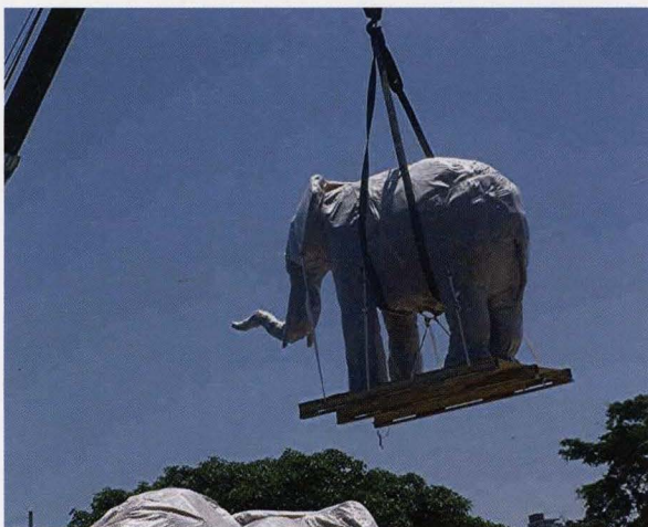
Een kudde olifanten van Andries Botha wordt ingescheept in Zuid-Afrika