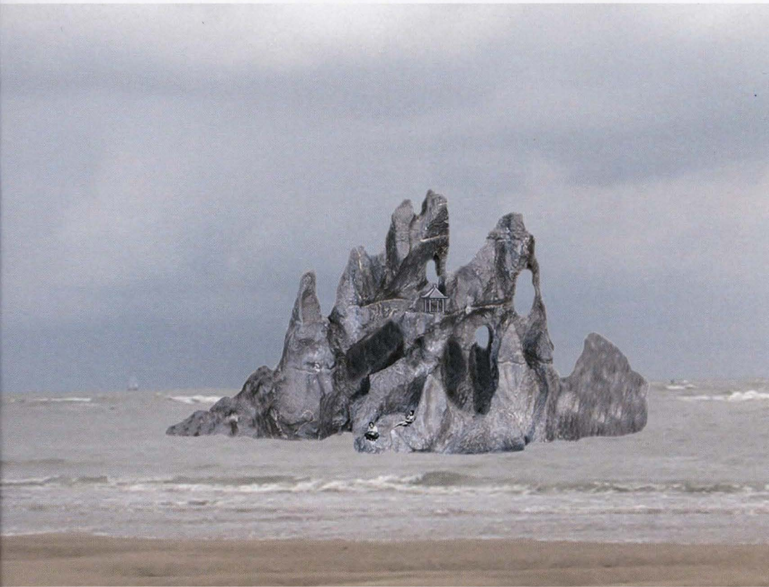
Zhan Wang, Floating Mountain of Immortels