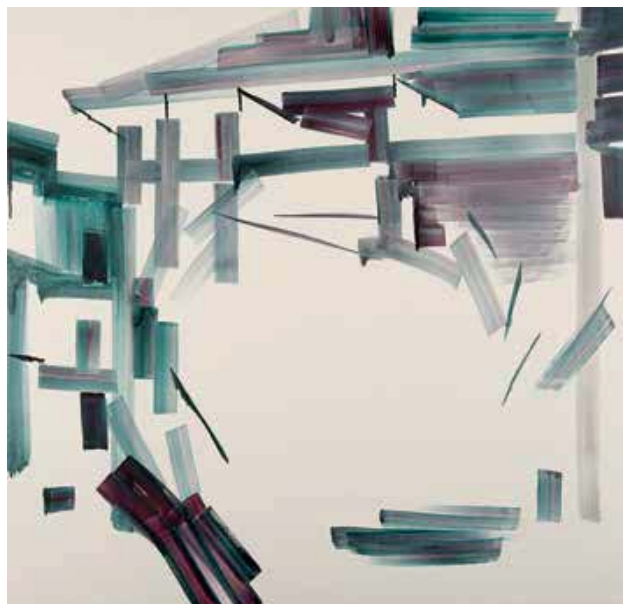
Virginie Bailly, Vide-Plein I, P01-01, 2009 , olieverf op doek, 150 x 150 cm Privéverzameling - FOTO: MICHAEL DELAUSNAY

De impressies die Virginie Bailly in het land opdoet, overrompen haar. Ze gaat er een tweede keer naartoe in 2009 en heeft twee jaar nodig om al die overweldigende indrukken te verwerken. Ze realiseert samen met Floris Dehantschutter een reeks korte video's. En de sporen van haar studie van de Chinese schilderkunst vinden we terug in werken als Vide-Plein I, P01-01 , een groot vierkant werk van anderhalve meter waarin het wit een belangrijke rol speelt. Het geeft een beeld van deconstructie, als van iets wat in elkaar stort