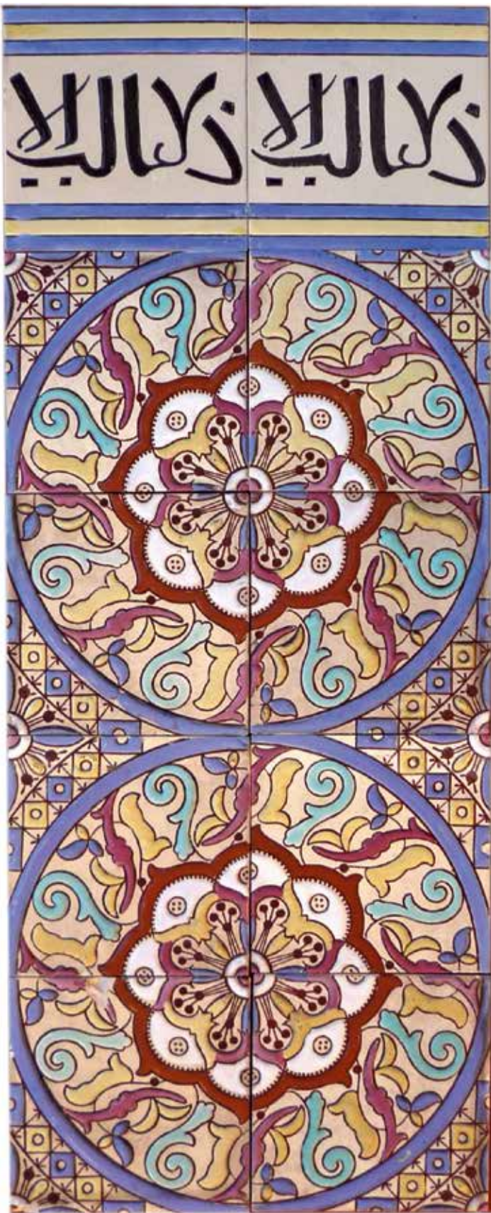
Tegellambrisering in steengoed voor binnen- en buitengebruik in Arabische stijl van Boch Frères La Louvière, ca. 1887