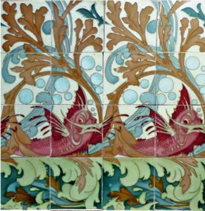
Deel van een tegellambrisering met vissen en zeewier naar ontwerp van H. Bonnerot voor de Manufacture de Céramiques d' Hemixem Gilliot & Cie, ca. 1911