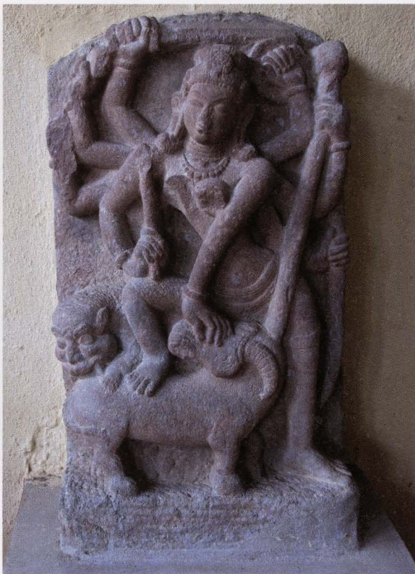
Shalabhanjika 2de eeuw?, vindplaats niet bekend, zandsteen, h ca. 120 cm PATNA MUSEUM, PATNA