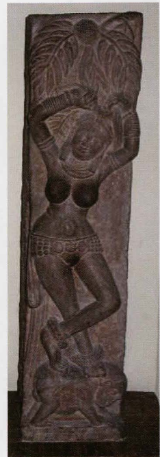
5. Yakshi (op pilaar van een omheining) 2de eeuw, vindplaats niet bekend, zandsteen, h 80 cm STATE MUSEUM, LUCKNOW

Sereniteit spreekt uit mediterende boeddha's, tirthankara's (24 jainistische heilanden) en beschouwende vormen van Shiva (meester van de yoga) en Vishnoe, als symbool van ingehouden energie. Dit staat in schril contrast met een reeks