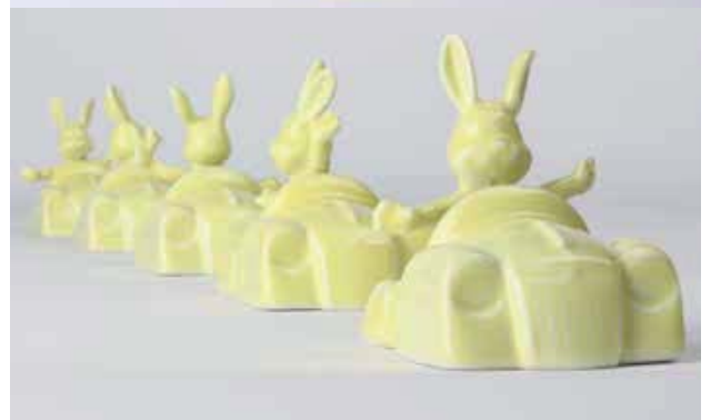
Jan Marechal, Act Like You Know , 2012, porselein, 10 cm COLLECTIE VAN DE KUNSTENAAR