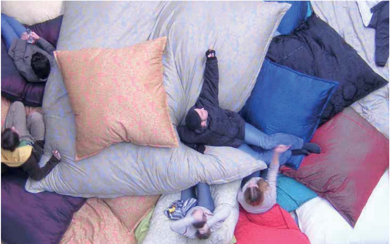
Jan Marechal, Snoezel , 2005, 600 cm

triënnale voor beeldende kunst, mode en design in Hasselt in 2005 (curator: Edith Doove), voor de dag kwam met Snoezel , een ruimte met reusachtige kussens waar het heerlijk relaxen en ravotten was.