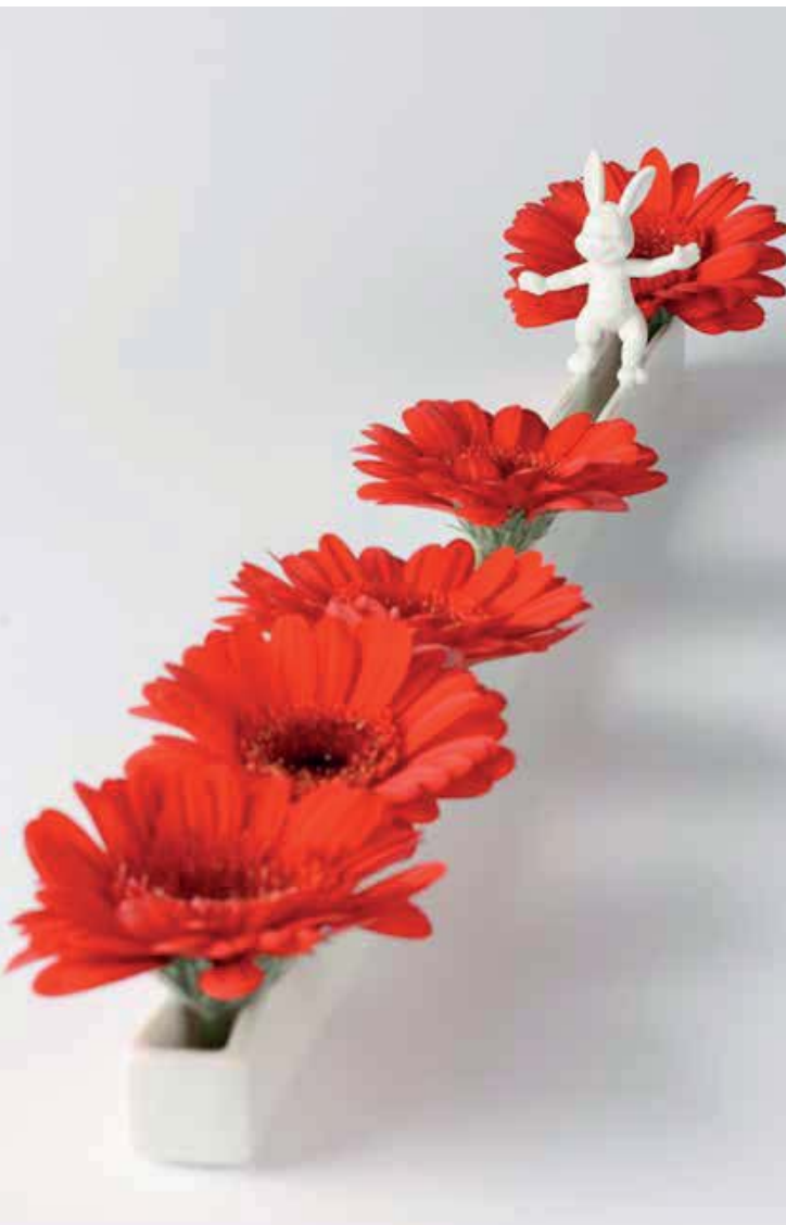
Jan Marechal, Flash Forward , 2012, porselein, 50 cm