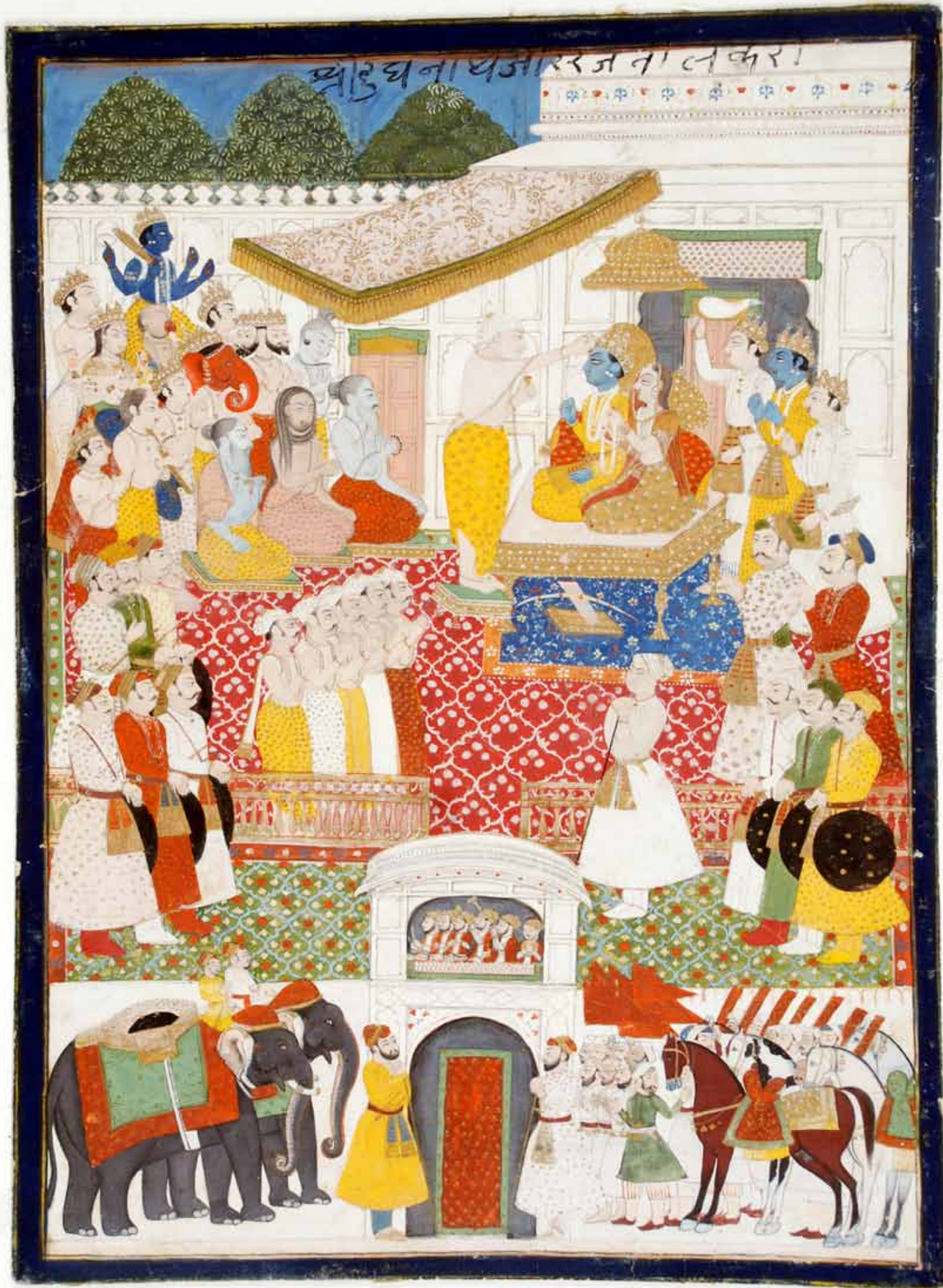
Tentoonstellingsnummer 90 De kroning van Rama door de wijze Vashishtha Jodhpur-stijl, Rajasthan, begin 19 de eeuw Papier, 33,6 cm x 24,7 cm