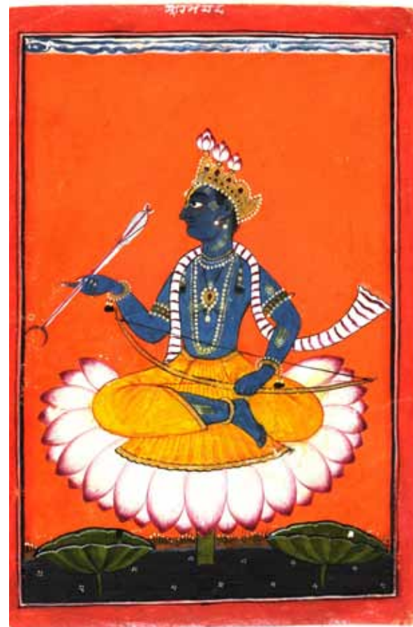
Tentoonstellingsnummer 1 Portret van Rama Basohli-stijl, Pahari, ca. 1730 Papier, 14,8 x 10,2 cm

De traditie van Indiase miniaturen is zeer oud. Omdat boeken aanvankelijk op langwerpige palmblederen werden geschreven, moesten de illustraties in die beperkte ruimte passen. Na de overschakeling op papier verhoogde het formaat tot ongeveer 30 bij 10 centimeter. In de dertiende eeuw kwam een nieuwe stroming de schilderkunst van het boeddhistische en hindoeïstische India beïnvloeden. De moslimhoven in India nodigden Perzische schilders uit en zij brachten nieuwe technieken en nieuwe onderwerpen mee. De miniaturschilderkunst maakte er gretig gebruik van en nam nog meer buitenlandse invloeden over. Zo bereikte ze van de zestiende tot de achttiende eeuw een ongekend niveau van verfijning onder de keizers van de Mogol-dynastie. Wanneer de Mogols de islam steeds strikter wilden volgen, moest de 'frivole kunst' er aan geloven. De schilders verlieten het keizerlijk hof en zwermden uit naar diverse provinciale hoven. Bijvoorbeeld naar Rajasthan in het noordwesten van India, waar de miniaturkunst al floreerde voor de mosliminvasies. De instroom van de uitgeweken schilders betekende een uitbarsting van creativiteit in de vele lokale schildersateliers, elk met een eigen stijlontwikkeling. En nadat in 1739 Delhi in Perzische handen kwam, bloeide de miniaturkunst op in de noordelijke voetheuvels van de Himalaya. Deze Pahari (van de bergen)-school telt tientallen bergstaten