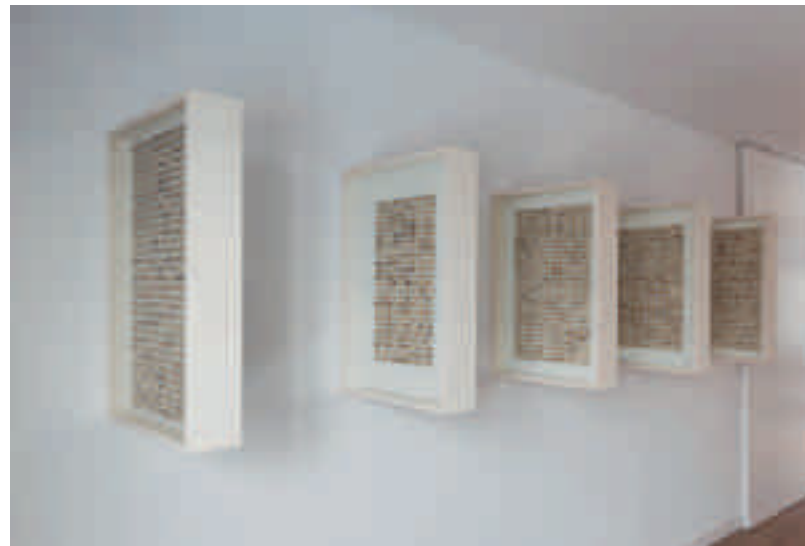
Patrick Keulemans, The copy paste society , 2015, 79 x 53,5 x 12,5 cm (5 x), perkament, leder, glas, acrylverf, witte acrylinkt en populierenmultiplex

Moeilijkheden kunnen interessante uitdagingen vormen. Bij Keulemans stimuleren ze hem tot allerlei associatieve