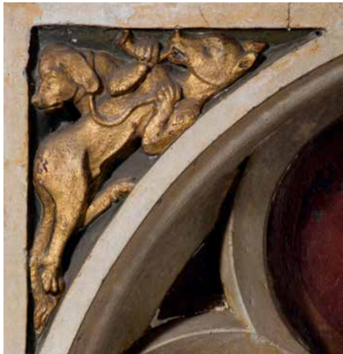
Hoekzwik 9: moraliserende vos en hond