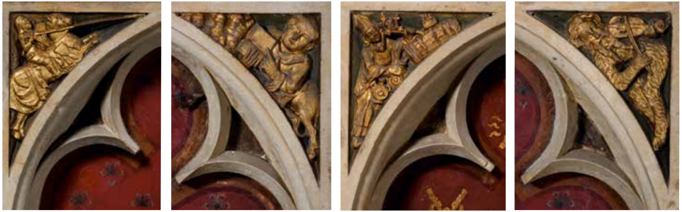
[van links naar rechts] Hoekzwik 35: steekspel - Hoekzwik 18: monnik met paardenlijf - Hoekzwik 75: Heilige Willibrord en het mirakel van de wijn - Hoekzwik 28: wildeman die vedel speelt

originele portretten, die van Gwijde van Dampierre en Robert de Bethune, zijn hun wapenuitrusting en zwaardknoppen identiek als die van de ridders op de zwikken.