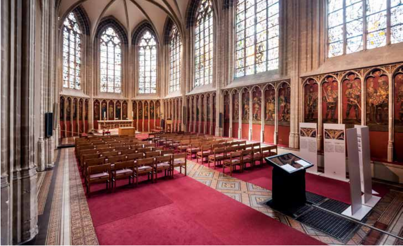
De Gravenkapel in de Onze-Lieve-Vrouwekerk in Kortrijk