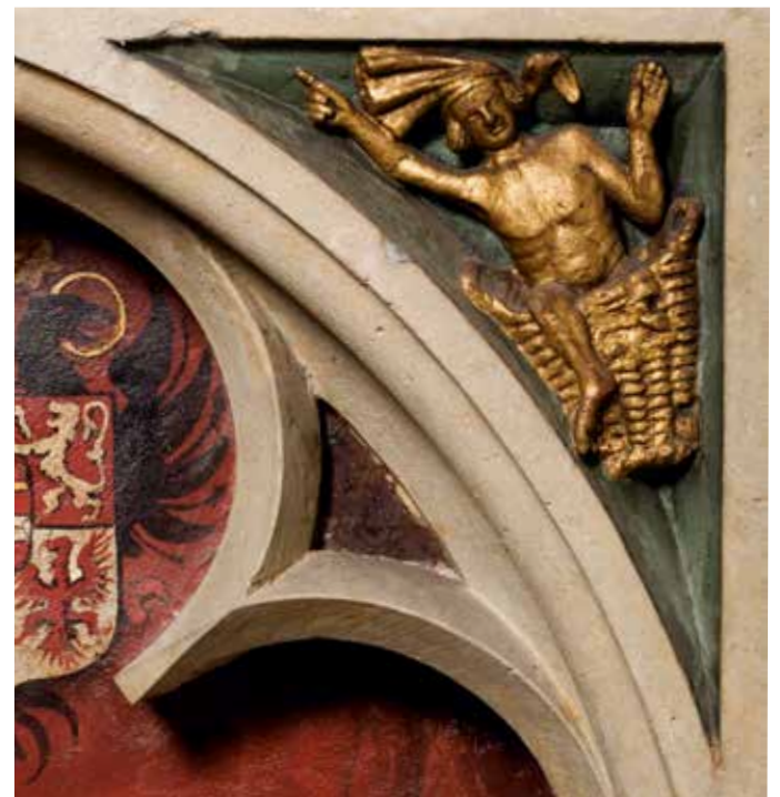
Hoekzwik 98: Vergilius in een mand