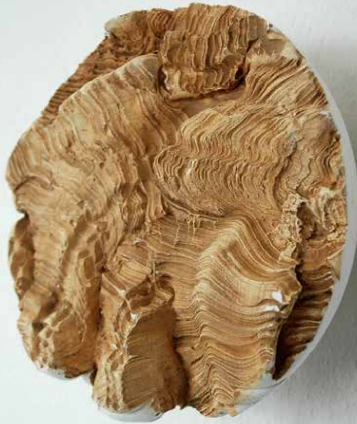
Lore Rabaut, Pieces of Earth XI , 2016, gips

In haar Monuments verenigt ze bijvoorbeeld beton en textiel. Het zijn monumenten voor een bepaalde emotionele beleving. Opvallend zijn het ook vormen die iets blijken in te houden, het zijn containers die een miniatuurlandschap bevatten. Ze verwijst hierbij uitdrukkelijk naar Gaston Bachelard, de Franse filosoof die het in zijn La poétique de l'espace heeft over onze eerste ruimtelijke gewaarwordingen als kind, hoe we dat dan transformeren en hoe een kistje of een lade een soort mentaal toevluchtsoord kan zijn. “Ik voel me daar heel erg toe aangetrokken, je kan dat zien in mijn werk met die kistjes en die boeken, de vrijheid die je daarin hebt om die te openen of te sluiten wanneer je maar wilt.”