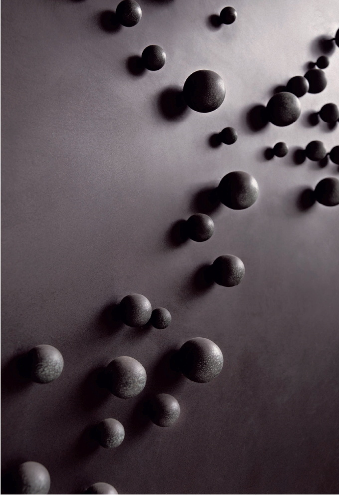
Pol Bury, 74 sphères sur un plan (detail), 1979