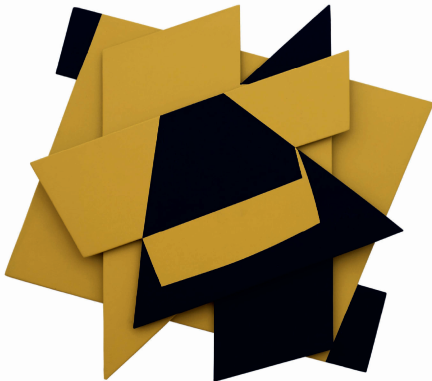
Pol Bury, Plans mobiles , 1953 PRIVÉCOLLECTIE

Voor het eerst in twintig jaar wordt bij ons een grote tentoonstelling gewijd aan Pol Bury en zijn schilderijen, beeldhouwwerken, installaties, fontein, juwelen, grafische werken en teksten.