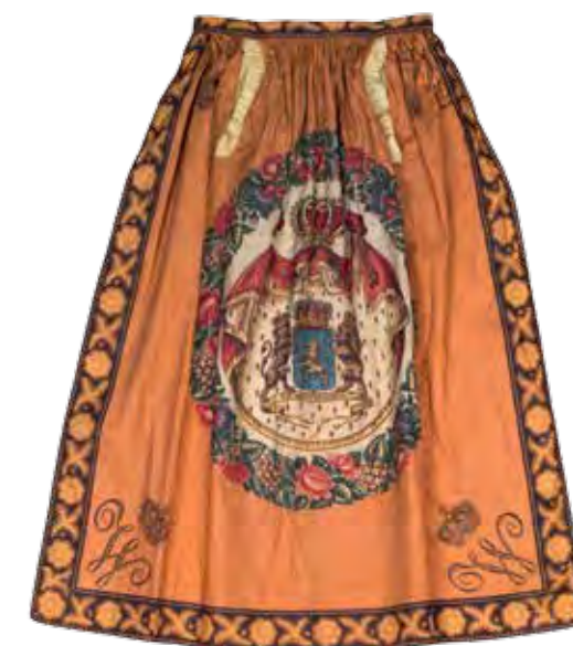
Orangistische sjaal Katoendrukkerij F. De Vos en Voortman, ca. 1835 STAM – STADMUSEUM GENT (FOTO MICHEL BUREZ)