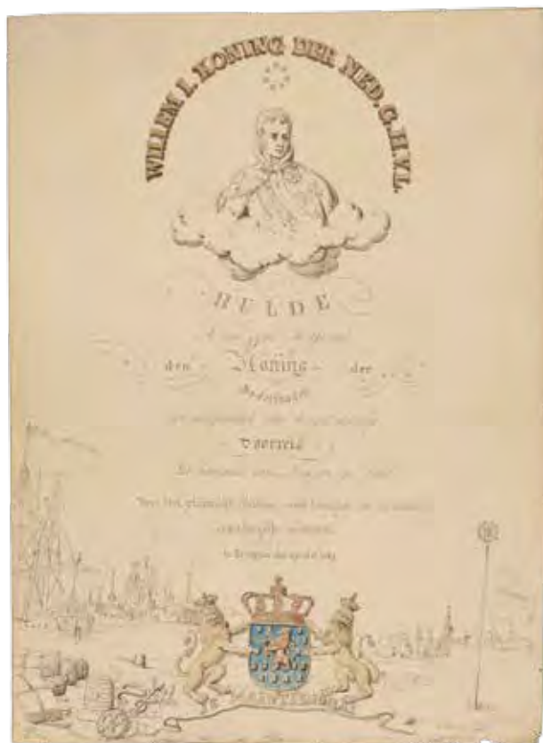
Huldeblijk van het gemeentebestuur van Evergem aan Willem I naar aanleiding van zijn rondreis in 1829

en hoopte door enkele toegevingen het tij te keren. Zo werd het Filosofisch College niet langer verplicht. De Journal de Gand , die vanaf 1 januari 1829 op kosten van de Nederlandse regering verscheen, liet zich schamper uit over de petitie. Op 10 december 1830 vervelde de Journal de Gand tot de Messenger de Gand , de befaamde moniteur van de orangisten.