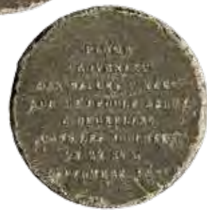
De aanval op het Bellevue Hotel in Brussel in 1830