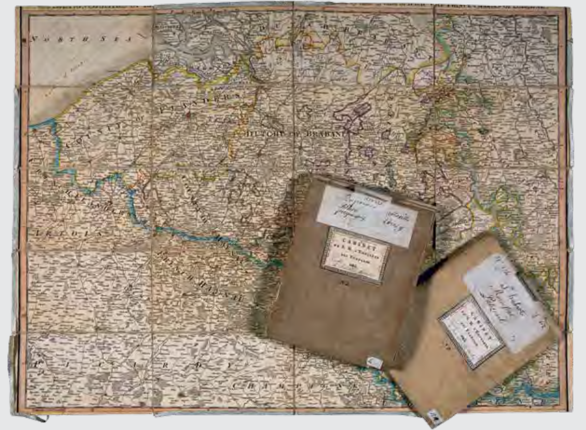
Stafkaarten van Napoleon, buitgemaakt na de slag bij Waterloo KONINKLIJKE VERZAMELINGEN DEN HAAG