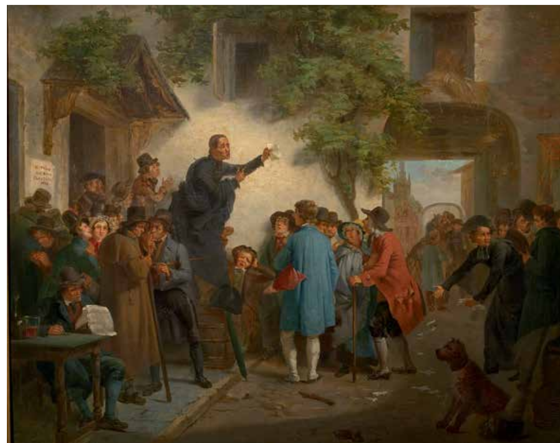
Bij de herberg. Verkiezingen in het district Gent J.-L. Geirnaert, 1831 KONINKLIJKE MUSEA VOOR SCHONE KUNSTEN VAN BELGIË, BRUSSEL