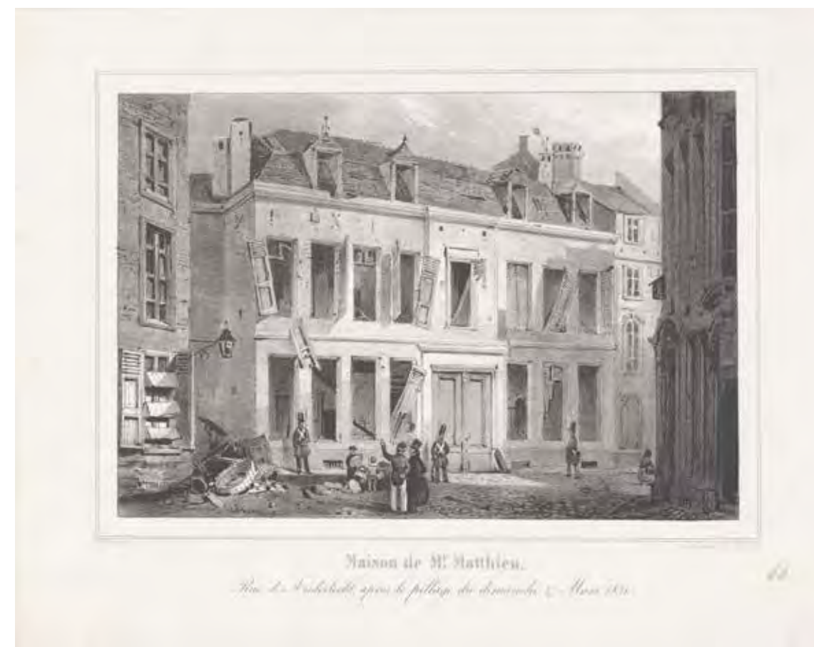
Het geplunderde huis van de Brusselse orangist Matthieu na de mislukte 'staatsgreep' in Antwerpen Th. Fourmois, 1831

De orangisten, overtuigde aanhangers van het Huis van Oranje-Nassau, waren de hardnekkigste tegenstanders van de onafhankelijkheid. Mandatarissen, ambtenaren en professoren, allen aangesteld door Willem, maakten er deel van uit, evenals de hofadel