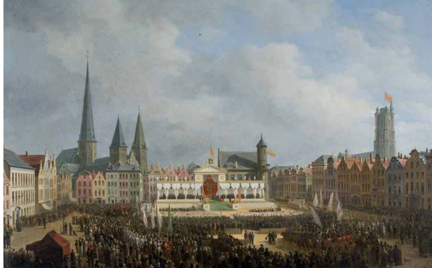
De prijsuitreiking aan de laureaten van de Gentse Nijverheidstentoonstelling in 1820