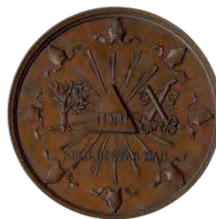
Gedenkpenning concordaat tussen paus Leo XII