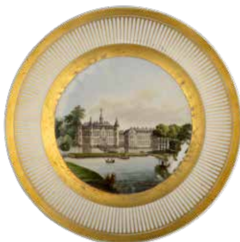
Porseleinen borden met gezichten op het koninkrijk.