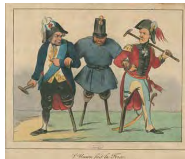
Het Voorlopig Bewind van België in 1830, Ch. Picqué, 1864