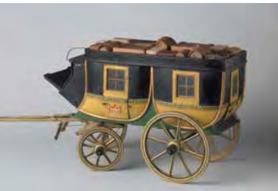
Schaalmodel van de postwagen Amsterdam-Gent RIJKSMUSEUM AMSTERDAM