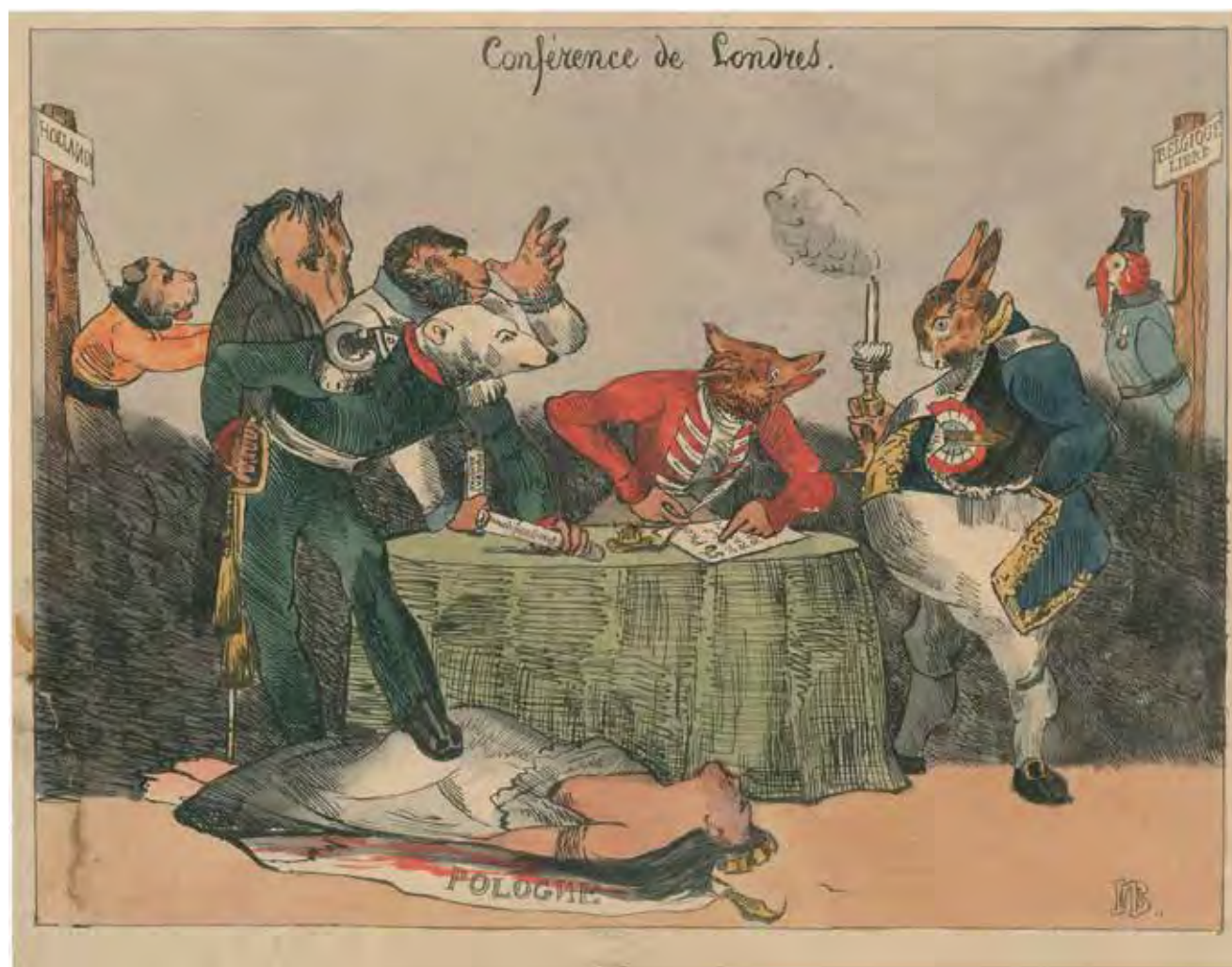
Spotprent op de Conferentie van Londen in 1830 © KONINKLIJK MUSEUM VAN HET LEGER EN DE KRIJGSGESCHIEDENIS, INV NR KLM-MRA : DD-D-191

DE INTERNATIONALE POSITIE VAN BELGIË De Europese hoofdsteden werden enigszins verrast door het succes van de Belgische opstand, die het Europees evenwicht, zoals uitgedokterd op het Congres van Wenen, in gevaar bracht. Dit betekende dat de mogendheden in Londen beslisten over het lot van de jonge staat. De onderhandelingen begonnen op 4 november. Willem had al eind augustus internationale hulp gevraagd, maar kreeg weinig reactie. De Russische tsaar wilde wel militair tussenkomen, maar de opstand in Polen verhinderde dat. Groot-Brittannië en Frankrijk stuurden al snel aan op een diplomatieke oplossing. Op 20 december 1830 erkenden de mogendheden de onafhankelijkheid van België. Een maand later, op 20 januari 1831, werd België voor eeuwig neutraal verklaard.