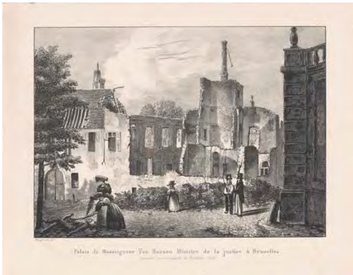
Palais de Monsieur Van Maanen, Ministre de la Justice à Bruxelles.

De ruïne van het huis van minister van Maanen in Brussel in 1830 Mogford, 1830-1831 RIJKSMUSEUM AMSTERDAM