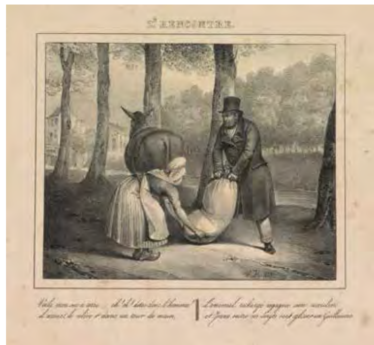
rechtsboven: Spotprent op het oppositieblad Le catholique des Pays-Bas 1829 RIJKSMUSEUM AMSTERDAM

In november 1829 lanceerde een vastbesloten oppositie een tweede petitiebeweging, die nogmaals alle grieven opsomde. Zij werd ondertekend door 360.000 mensen, waarvan 240.000 in Vlaanderen. Volgens provinciegouverneur Van Doorn lag het succes vooral aan de inzet van pastoors, die zich ontpopten tot ware "colporteurs de pétitions." In Gent kenden zij amper succes: "Alle voorname kooplieden en fabrykanten, die in deze stad de talrykste, de rykste, de meeste invloed hebben, de klasse der ingezetenen uytmaken heben hunne medewerking aan de zaak geweigerd." Aanhangers van Willem organiseerden tegenpetities, maar de reactie was beperkt. In Gent werden in totaal 237 handtekeningen verzameld. Een woedende Willem richtte zich op 11 december 1829 tot de Staten-Generaal. Hij verdedigde al zijn realisaties en veroordeelde ongemeen scherp de persvrijheid. In Brussel richtte hij de krant Le National op, die hij volledig zelf financierde. Hoofdredacteur werd de Florentijnse journalist-avonturier Giorgio Libri-Bagnano (1780-1836). Begin 1830 escaleerde het conflict tussen de koning en een steeds onverzettelijker oppositie verder.