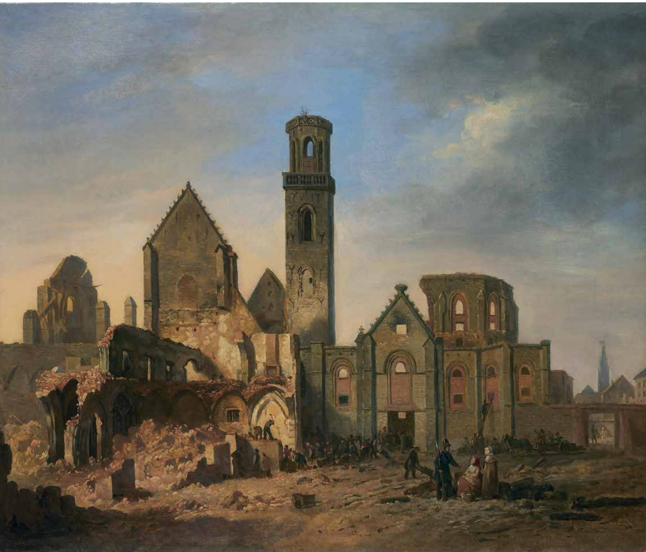
Gezicht op de Sint-Michielsabdij na het bombardement van 27 oktober 1830, Ph. van Bree ANTWERPEN, MAS / COLLECTIE VLEESHUIS, INV.NR. 7338