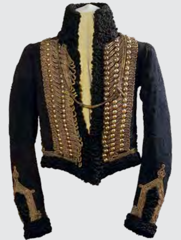
Dolman gedragen door kroonprins Willem tijdens de slag bij Waterloo

Willem I had ambitieuze huwelijksplannen voor zijn oudste zoon, en het prestige, verworven door de kroonprins in Waterloo, hielp daarbij. Er waren plannen voor een huwelijk met prinses Charlotte, de Britse troonopvolgster. Haar enthousiasme was evenwel niet groot, en in 1816 trouwde zij met Leopold van Saksen-Coburg. Het kan verkeren. Op 21 juli 1831 legde diezelfde Leopold de eed af als koning van België. Kroonprins Willem trouwde met Anna Paulowna, een zus van de Russische tsaar.