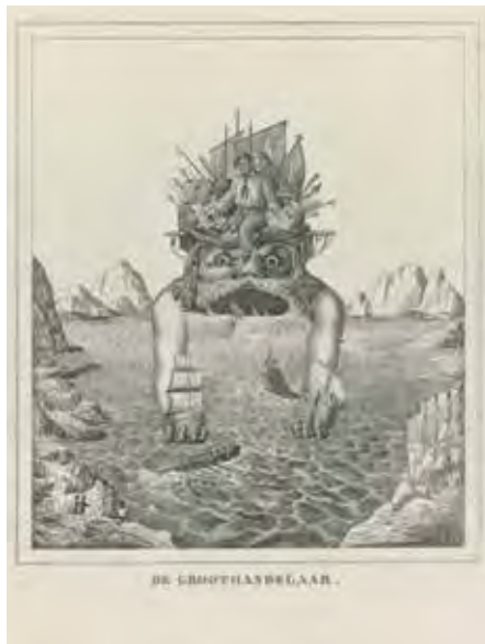
Spotprent op de oprichting van de Nederlandse Handel-maatschappij, 1824 RIJKSMUSEUM AMSTERDAM