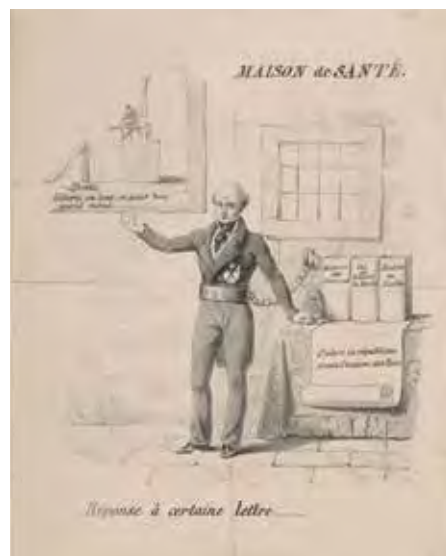
Spotprint van Louis de Potter, 1828-1830