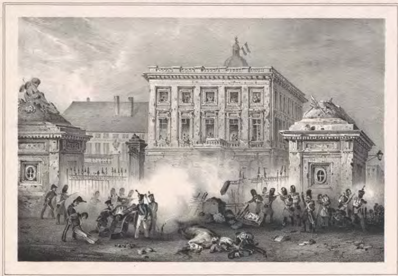
Attaque de l'Hôtel de Belle Vue par les troupes.