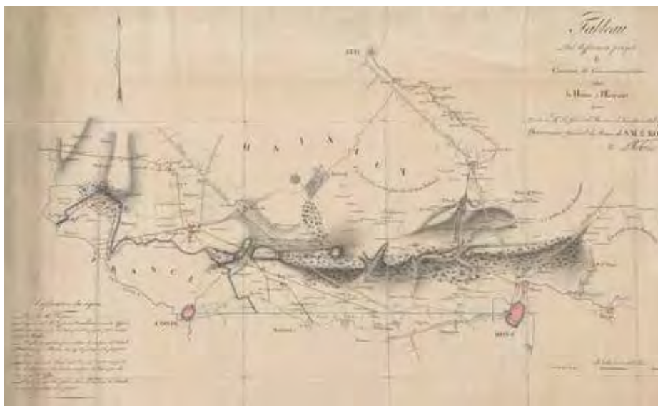
Kaart met verschillende plannen voor het verbindingskanaal tussen Hene (Haine) en Schelde NATIONAAL ARCHIEF DEN HAAG