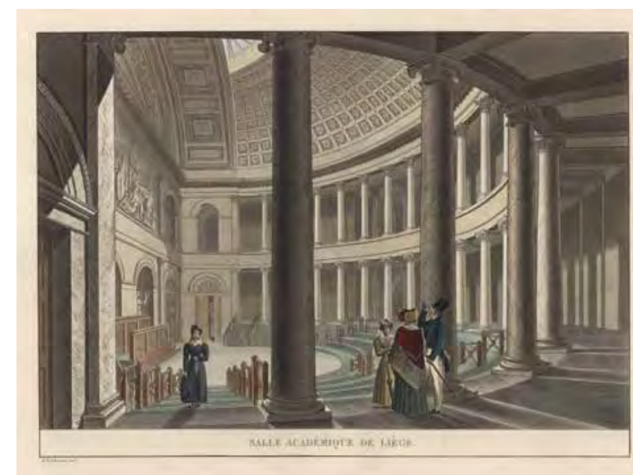
De 'Salle académique' van de Luikse universiteit gebouwd naar ontwerp van stadsarchitect J.N. Chevron