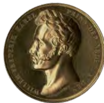
Gouden erepenning van de Nederlandse prins Frederik aan H. Metdepenningen I.P. Schouberg, 1879 STAM – STADSMUSEUM GENT