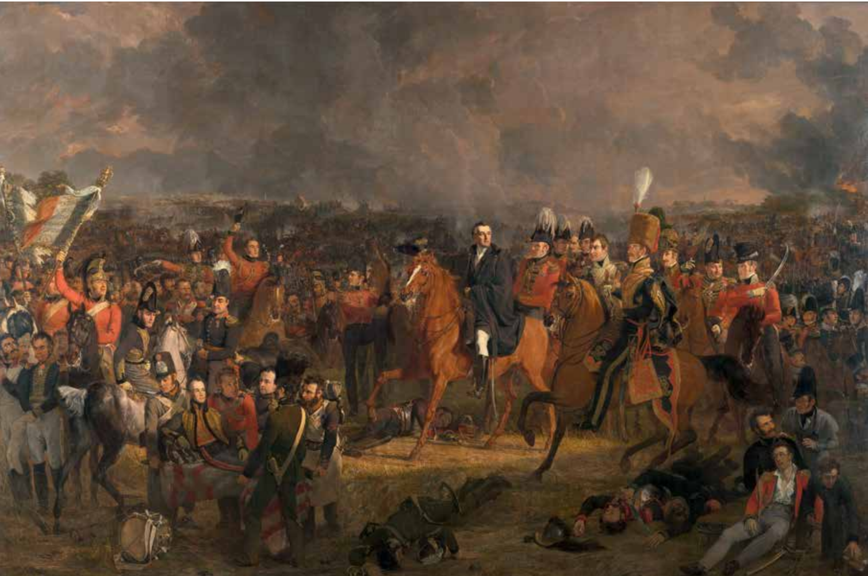
De slag bij Waterloo, J.W. Pieneman, 1824 RIJKSMUSEUM AMSTERDAM

Met de slag bij Waterloo op 18 juni 1815 kwam er een einde aan een zeer woelige periode in de Europese geschiedenis, die was begonnen met Franse revolutie in 1789. Vanaf september 1814 probeerden afgevaardigden van Oostenrijk, Pruisen, Rusland en Groot-Brittannië op het Congres van Wenen de kaart van Europa te hertekenen. Zij streefden naar een evenwicht tussen de verschillende mogendheden, met als doel een langdurig status-quo. Frankrijk werd omringd door bufferstaten, die zowel de Franse expansiedrang als de verspreiding van revolutionaire ideeën moesten tegenhouden. De werkzaamheden in Wenen werden doorkruist door Napoleons terugkeer tijdens de Honderd Dagen, maar zijn nederlaag in Waterloo op 18 juni 1815 maakte voorgoed een einde aan de napoleontische oorlogen.