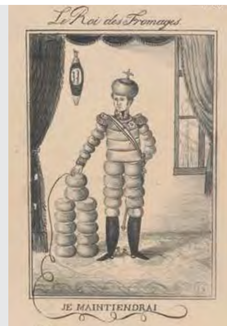
Spotprent van Willem I als Koning Kaas, 1830-1831

De 'kanalenkoning' was een bekende bijnaam van Willem, maar hij had er verschillende. Op 21 september 1815 werd Willem I ingehuldigd op het Koningsplein in Brussel. Voor de gelegenheid had Willem een goudkleurig beschilderde koperen kroon laten maken, versierd met imitatiestenen van gekleurd glas. Bij de inhuldiging werden vooral koperen, niet zo zeer gouden of zilveren penningen uitgestrooid onder het volk. Meer was niet nodig voor de aanwezigen om Willem meteen om te dopen tot 'koperen koning'. Willem was een harde werker, die dagelijks 12 à 14 uur in zijn werkkamer doorbracht. Daar ondertekende hij volgens sommigen ongeveer een miljoen besluiten, wat hem de bijnaam 'besluitenkoning' opleverde. Zijn werkkamer werd 'de papierfabriek' genoemd. Op 9 maart 1824 werd in Den Haag, op initiatief van Willem, de Nederlandsche Handel-maatschappij opgericht, die de export naar de kolonies steunde. Sommigen zagen in deze maatschappij een geduchte concurrent voor kleinere ondernemingen en rederijen. Wilde de alomtegenwoordige Willem ook een deel van de handel met de kolonies in handen krijgen? Een en ander leverde hem de bijnaam 'koning koopman' op. Tijdens de Belgische opstand verschenen in het zuiden weinig vleierende karikaturen van Willem als 'Koning kaas'. Na 1830 werden de orangisten smalend 'kaasgezinden' genoemd.