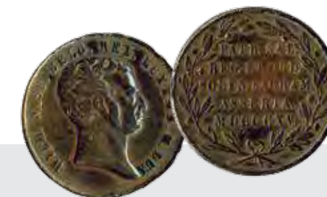
Koperen inhuldigingspenning van Willem I, 1815 STAM – STADMUSEUM GENT