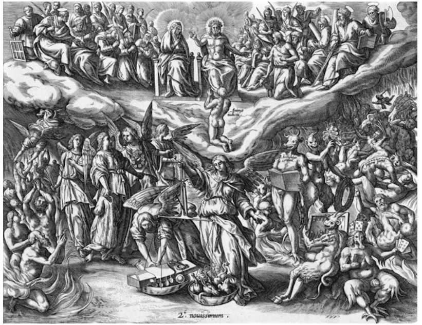
J. Wierix naar Maarten de Vos, Het laatste oordeel met kaartende duivels , ets, uitgegeven door J.B. Vrints, Antwerpen, ca. 1600

Een replica van een guillotine verwijst naar het lot van Lodewijk XVI tijdens de Franse Revolutie. Tot in het kaartspel moest de koning het ontgelden. De figuurkaarten werden vervangen door de idealen van de Franse Revolutie. Zo werd één van de boeren de 'gelijkheid van plicht', in de persoon van een soldaat. Ook de oorlog was nu eenmaal democratisch, dus iedereen soldaat. Al deze nieuwe figuren bemoeilijkten de herkenbaarheid tijdens het spel, zodat er een nieuw officieel kaartspel werd ingevoerd. Napoleon figureerde daarin als ruitenheer, omdat deze kaart traditioneel Julius Caesar voorstelde. Dat paste wel bij zijn profiel als grote en onoverwinnelijke veldheer annex staatsman. Om te besparen, kregen bestaande houtblokken retouches. De expo toon hiervan enkele voorbeelden: de kroon is vervangen door een onbestemd hoedje, het woord 'roi' is doorgehaald.