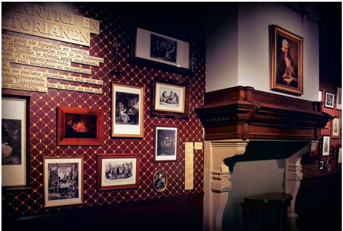
Eén van de vijf kernverhalen van ‘Harten 5’: romantici en Victorianen