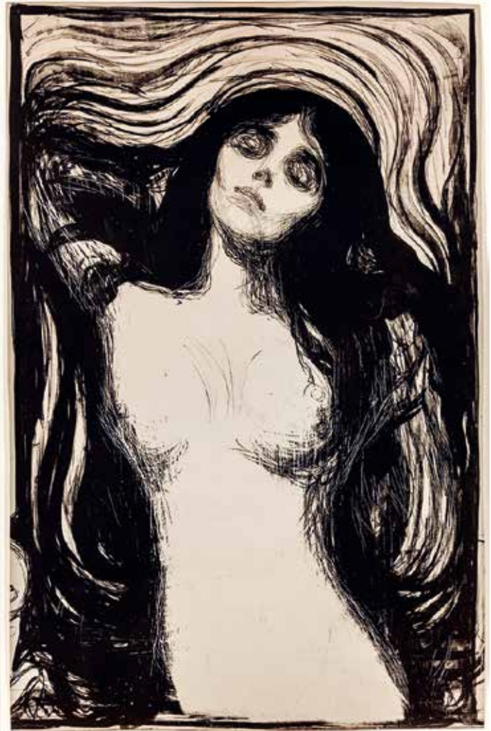
Edvard Munch, Madonna , 1895-1902, litho MUSEUM DE REEDE, ANTWERPEN

Museum De Reede is ondergebracht in de onderste verdiepingen van een wooncomplex uit het jaar 2000 dat, vanwege het uitzicht op de reede van Antwerpen, de voor de hand lig-