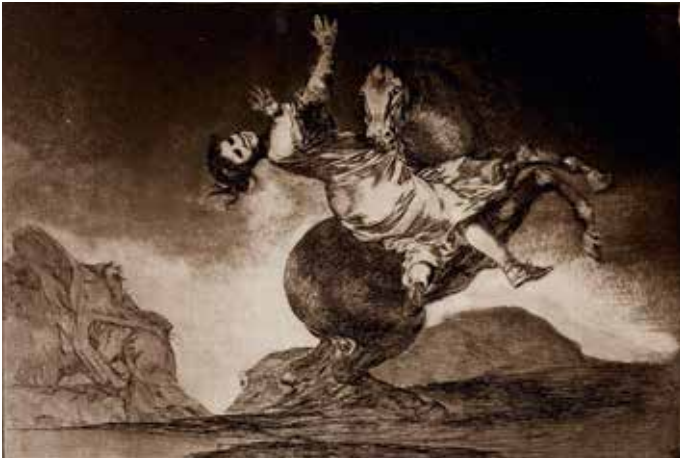
Francisco Goya, El caballo raptor , 1815-1819, ets / aquatint ( Los Disparates )