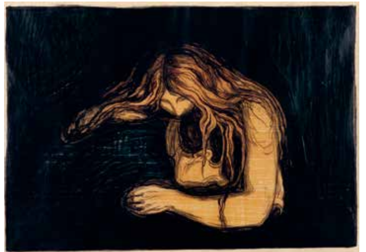
Edvard Munch, Vampire II , 1895-1902, litho en houtsnede MUSEUM DE REEDE, ANTWERPEN