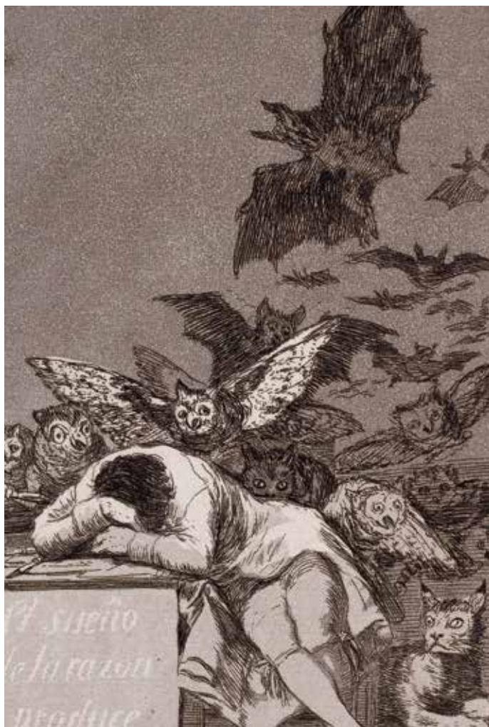
Francisco Goya, El sueño de la razón produce monstruos , 1799, ets / aquatint ( Los Caprichos ) MUSEUM DE REEDE, ANTWERPEN