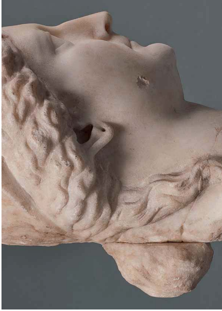
Levensgroot hoofd van Livia, de vrouw van de Romeinse keizer Augustus, eerste eeuw na Christus, marmer.