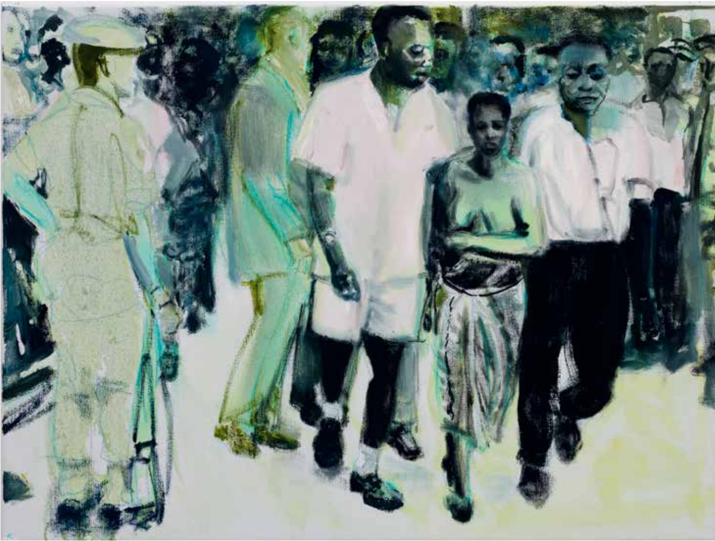
Marlene Dumas, The Widow , 2013, olieverf op doek, 60 x 80 cm DEFARES COLLECTIE, AMSTERDAM