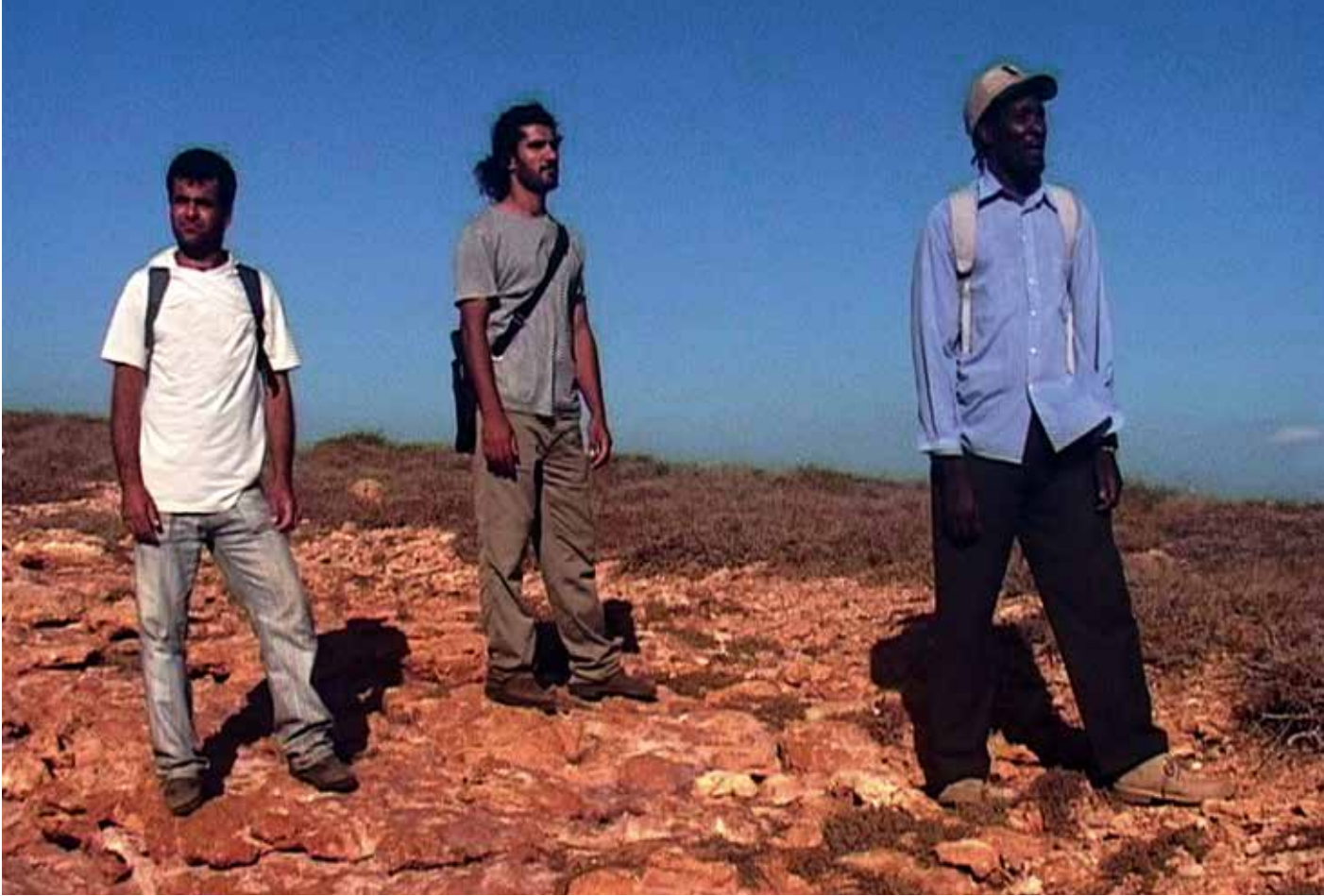
Stefanos Tsivopoulos, Land , 2006

Thematische clusters als Dealing with Catastrophe , Liminal Difference en Reflections on Cultural Complexity lijken rechtstreeks in te gaan op actuele problematieken. Weinig individuele kunstwerken in de tentoonstelling staan overigens los van politieke of maatschappelijke connotaties. De Griek Costas Varotsos maakte een monument voor een schip vol Albanese migranten dat in 1997 voor de Italiaanse kust zonk. De schroef van het schip is verwerkt in een complexe glazen sculptuur die de woestheid van de zee evoceert. In de actuele context is het moeilijk hier geen bedenking rond de vluchtelingen crisis bij te maken. De video Land van Stefanos Tsivopoulos geeft te denken over de migratieproblematiek en meer bepaald de taalkundige en culturele confrontaties die daarmee gepaard gaan. “Drie mensen bevinden zich op een eiland, en bevragen hun positie in hun eigen taal. (...) De film gaat over interpersoonlijke relaties en (mis)communicatie,” legt Schizakis uit. Ook Luc Deleu bevraagt geografische grenzen in werken als Mobile Medium University Revisited en Around the World in 80 Days . “Deleu bedacht het concept ‘urbanisme’ toen hij reflecteerde over de verhouding tussen de schaal van de wereld en de menselijke schaal,” vertelt Schizakis. “Hij gaat uit van een ‘globale stad’. In dit wereldbeeld, waarin de wereld één organisatorisch geheel vormt, zijn meer mobiliteit en vrijheid mogelijk.”