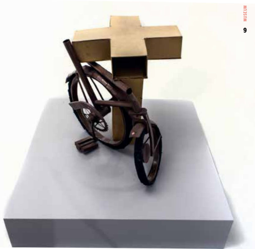
Panamarenko, Zwitserse fiets , 1969