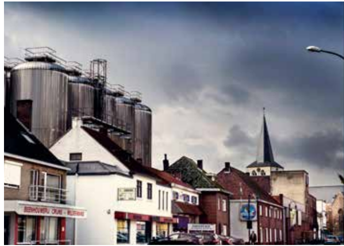
Wat winkels, brouwerij Martens en de toren van de Sint-Laurentiuskerk