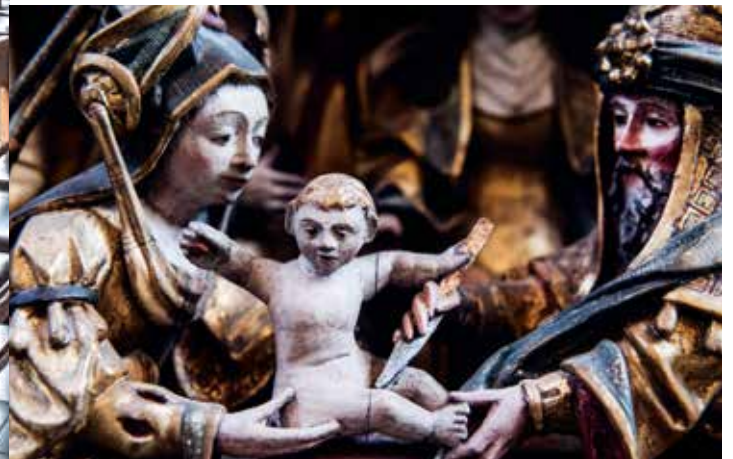
De besnijdenis van Jezus met behulp van een angstaanjagend mes

ONBELEEFDE CATHARINA Vouwt men het retabel open, dan valt de asymmetrie van de schilderijen op; is het gesloten, dan lijkt de H. Catharina nogal onbeleefd weg te kijken van de H. Maagd. Wat is er eigenlijk aan de hand met het retabel van Bocholt? We weten dat er oorspronkelijk niet minder dan drie retabels in de Sint-Laurentiuskerk stonden. Ze raakten verspreid of gingen verloren. Het huidige Mariare-