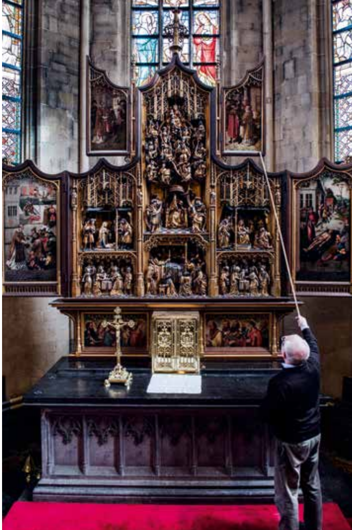
De luiken moeten geopend worden met een lange stok