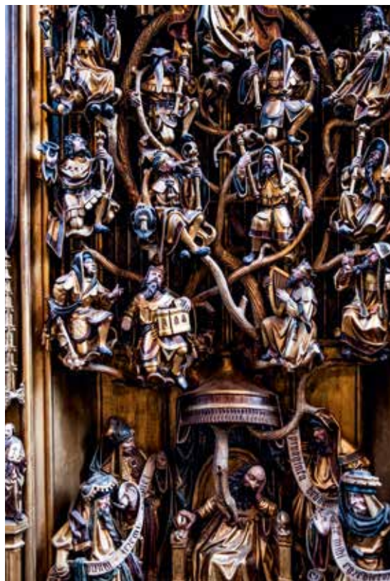
Uit de romp van de dromende Jesse rijst een sierlijk vertakte stamboom op

SPREKENDE DETAILS Pas wanneer de luiken geopend worden, blijkt hoe bijzonder dit retabel is. Dan zijn de schilderingen slechts randversieringen rondom een sprookjesachtige architectuur van beeldhouwde taferelen vol poppetjes in zestiende-eeuwse klederdracht. De schikking is sterk symbolisch en toont verschillende taferelen uit het leven van Maria. Het centrale paneel is een indrukwekkende weergave van de Virga Jesse: de twijg aan de stamboom van Jesse, oftewel de stamboom van Maria en Jezus. Jesse of Isaï van Bethlehem was de vader van koning David, die door de evangelisten Mattheus en Lucas genoemd wordt als een voorvader van Christus. De middeleeuwse belangstelling voor Jesse berust op een uitspraak van de profeet Jesaja; “Een twijg ontspruit aan de stronk van Jesse, een telg ontbloeit aan zijn wortel. De geest van JHWH rust op Hem” (Jesaja 11,01-02). De onbekende Antwerpse beeldhouwer creëerde een dromende Jesse, uit wiens romp een sierlijk vertakte boom oprijst. Op de takken zitten koningen en hun verwanten, helemaal bovenaan troont Maria met het kind Jezus onder een baldakijn van pinakels. Rondom de slapende Jesse staan de vier grote profeten die Christus’ komst hebben voorspeld: Jesaja, Jeremia, Ezechiël en Daniël.