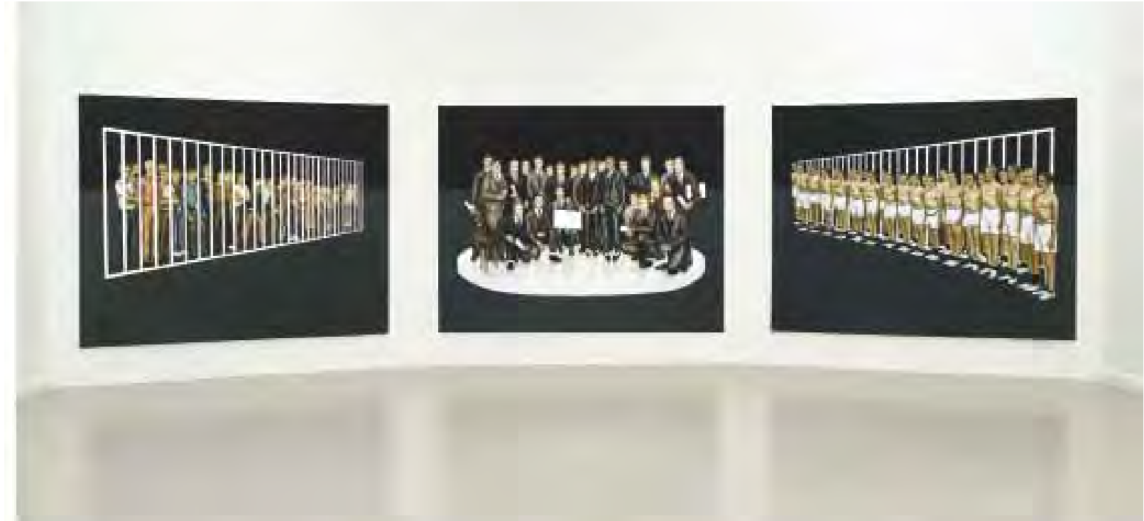
Helmut Stallaerts, Peter , 2013, hars en olieverf op doek, 175 x 120 cm