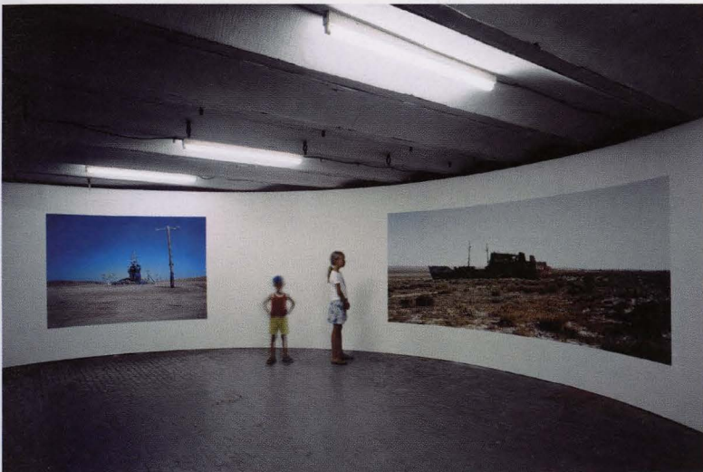
Freestate TENTOONSTELLING IN OOSTENDE