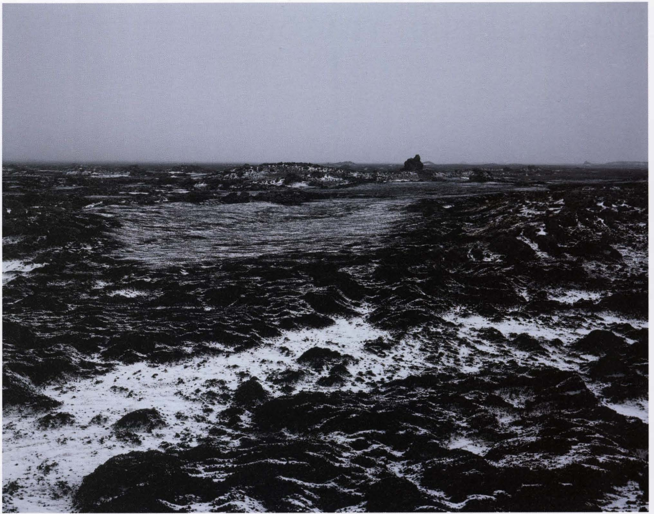
Near Hekla 2000