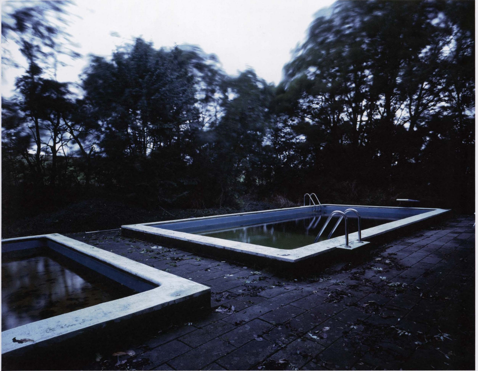
Pools at dawn 1999