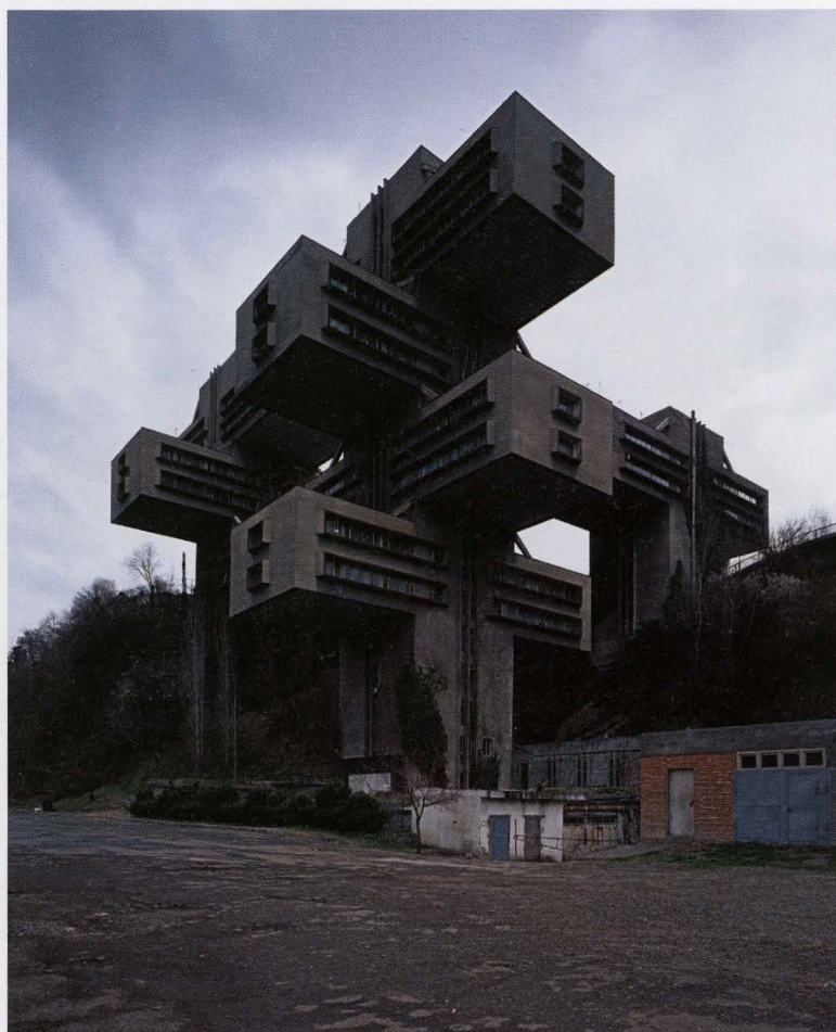
Ministry of Transportation 2003

Architectuur neemt een voorname plaats in binnen het oeuvre van Goiris. En het gaat hier dan niet om glamour en bejubelde architectuur. Het gaat om gebouwen die hem op één of andere wijze hebben aangegrepen of geïntrigeerd. Zo is er het onwaarschijnlijke Ministry of Transportation van Georgië, een avant-gardistisch project dat nu wat staat te verkommeren in Tbilisi. Of de schijnbaar uit de science fiction geplukte Futuro -woning die als een UFO tussen de bomen is geland ergens in Scandinavië en de futuristische woonbollen veel dichter