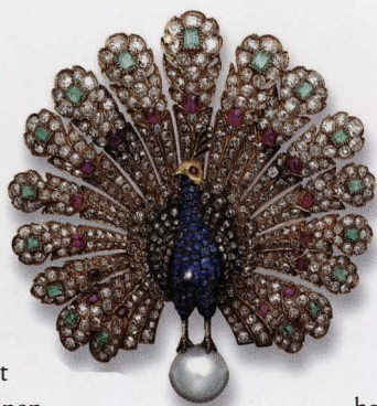
Broche in de vorm van een pauw, G. Baugrand, Frankrijk, ca. 1867

“Daarom wil ik nu in de eerste plaats iedereen leren kennen en al de communicatieve