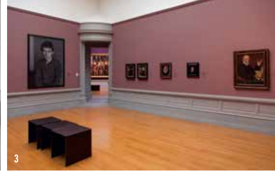
1. Eén van de grote zalen met schilderijen van de negentiende eeuw - 2. Luc Tuymans, The Arena, 2017, fresco 3. Zaal met zestiende-eeuwse portretten van o.a. Gerard Horenbout en Frans I Pourbus en met een portret van Craigie Horsfield uit de S.M.A.K.-collectie

In de tweede zaal wordt hetzelfde principe gehuldigd maar meer ingehouden. Hier komen voornamelijk de impressionistische schilders aan bod. Er zijn dialogen opgezet, maar de ademruimte blijft zeer beperkt. Misschien was het eerder aangewezen om deze negentiende-eeuwse wijze van exposeren bij wijze van didactiek voor te behouden aan een kleinere ruimte.