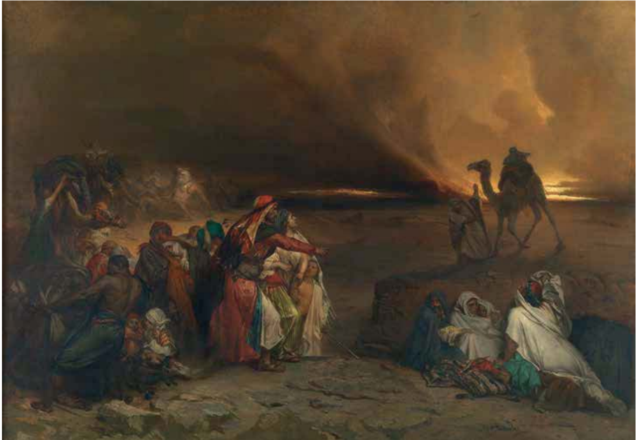
Jean Portaels, Een karavaan in Syrië verrast door de amoen, [1854-1855], olieverf op doek, 136,5 x 193 cm Koninklijke Musea voor Schone Kunsten van België, Brussel, inv. 3001

GROTE INVLOED De positie van Portaels in onze kunst wordt medebepaald door zijn invloed op de volgende generatie via zijn vrij atelier en uiteraard ook als directeur van de belangrijkste academie. Heel wat latere beroemdheden begonnen daar hun loopbaan: Emile Wauters (1846-1933), Edouard Agneessens (1842-1885), Léon Frédéric (1856-1940), Ernest Blanc-Garin (1843-1916), Xavier Mellery (1845-1921), de gebroeders Van Oyen, Jenny Montigny (1875-1937), Isidore Verheyden (1846-1905), Charles Van der Stappen (1843-1910)... Het Paleis voor Schone Kunsten toonde in 1883 een tentoonstelling van 407 werken van 24 kunstenaars die in het vrije atelier van Portaels lessen volgden. De kritiek was zeer lovend. In L'Art Moderne kon men lezen: "(het gaat om) een opmerkelijk artistiek evenement en vooral een eerbetoon van de leerlingen aan hun zo geliefde meester." Jules