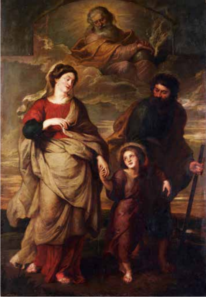
Peter Paul Rubens, De terugkeer van de Heilige Familie , ca. 1620, olieverf op doek, 259 x 117 cm, voor de restauratie SINT-CAROLUS BORROMEUSKERK, ANTWERPEN

de uit in 1718 en Rubens' negenendertig plafondschilderingen in de galerijen van de zijbeuken kon men niet redden. In 1773 volgde een zwaardere klap. Bij pauselijk bevel werd de Jezuïetenorde opgeheven. Jezuïetenkloosters sloten noodgedwongen hun deuren, de inboedels van jezuïetenkerken werden openbaar verkocht. Het Habsburgse hof liet Rubens' twee schilderijen voor het hoofdaltaar overkomen naar Wenen. De rest verkocht men openbaar in 1777. De terugkeer van de H. familie begon aan een eeuwenlange omzwerving door Europa. In 1871 kocht het Metropolitan Museum in New York het schilderij. Daar voerde men verschillende ingrijpende restauraties uit: om te beginnen werd de paneelschildering overgebracht op doek, een gevaarlijke onderneming. Al die werkzaamheden leidden tot een groot verlies van picturale kwaliteit. De bestuurders van het Metropolitan begonnen te twijfelen aan de waarde van hun aankoop en het doek verhuisde naar het magazijn. In 1980 was de liefde zodanig bekoeld dat het museumbestuur De terugkeer van de H. familie