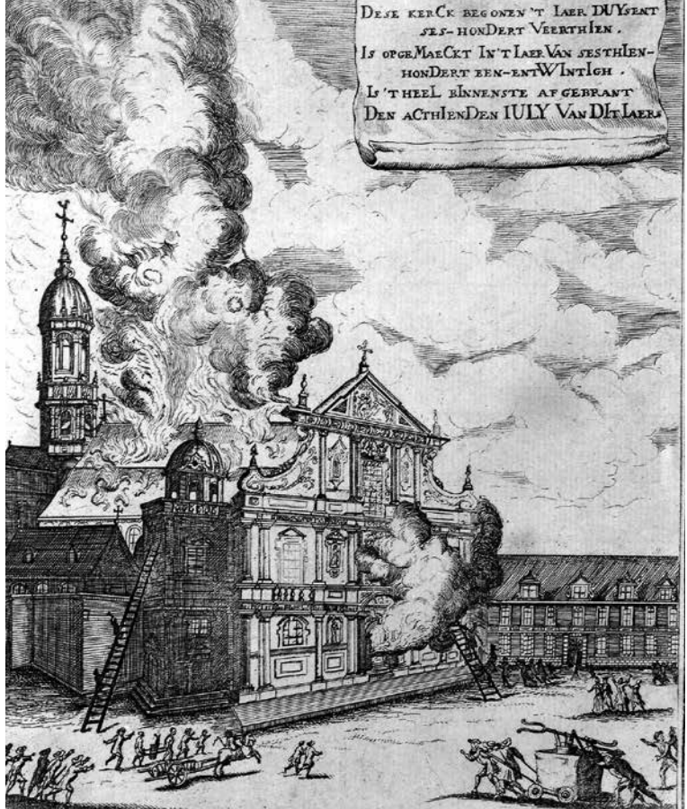
Pieter Balthazar Bouxtats, Brand van de Sint-Carolus Borromeuskerk te Antwerpen , 1718, prent, 200 x 160 mm