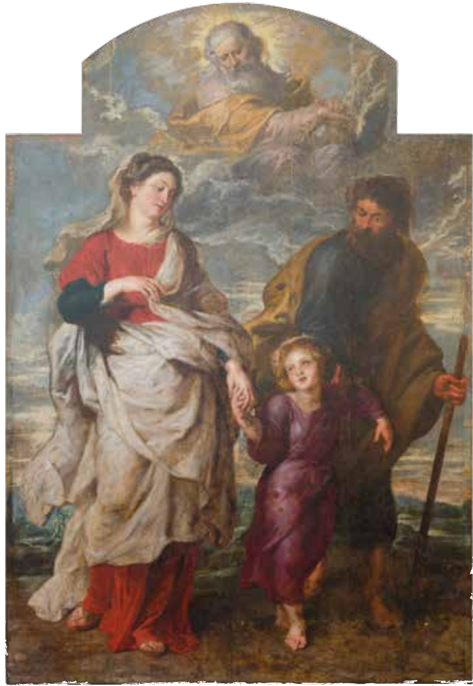
De terugkeer van de Heilige Familie tijdens retouche door het Koninklijk Instituut voor het Kunstpatrimonium, Brussel

de uit in 1718 en Rubens' negenendertig plafondschilderingen in de galerijen van de zijbeuken kon men niet redden. In 1773 volgde een zwaardere klap. Bij pauselijk bevel werd de Jezuïetenorde opgeheven. Jezuïetenkloosters sloten noodgedwongen hun deuren, de inboedels van jezuïetenkerken werden openbaar verkocht. Het Habsburgse hof liet Rubens' twee schilderijen voor het hoofdaltaar overkomen naar Wenen. De rest verkocht men openbaar in 1777. De terugkeer van de H. familie begon aan een eeuwenlange omzwerving door Europa. In 1871 kocht het Metropolitan Museum in New York het schilderij. Daar voerde men verschillende ingrijpende restauraties uit: om te beginnen werd de paneelschildering overgebracht op doek, een gevaarlijke onderneming. Al die werkzaamheden leidden tot een groot verlies van picturale kwaliteit. De bestuurders van het Metropolitan begonnen te twijfelen aan de waarde van hun aankoop en het doek verhuisde naar het magazijn. In 1980 was de liefde zodanig bekoeld dat het museumbestuur De terugkeer van de H. familie