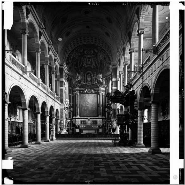
Theodor von Lüpke e.a., Het interieur van de Sint-Carolus Borromeuskerk in Antwerpen , 8 november 1917, zilvergelatine op glas, 40 x 40 cm