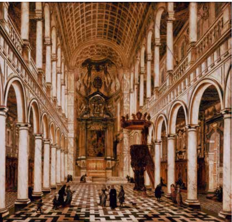
Willem Schubert von Ehrenberg, Interieur van de Sint-Carolus Borromeuskerk , 1668, olieverf op marmer, 97,5 x 103 cm

INFO Sint-Carolus Borromeuskerk, Hendrik Conscienceplein, 2000 Antwerpen – Open: maandag t.e.m. zaterdag van 10.00 tot 12.30 uur en van 14.00 tot 17.00 uur – Erediensten op zondag: 11.30 uur (Artiestenmis) en 17.00 uur – Sint-Egidius avondgebed: maandag t.e.m. vrijdag om 20.00 uur – www.carolusborromeus.com – Op vrijdag 23 juni is de kerk voor het publiek open vanaf 14 uur. TOPA-gidsen zijn aanwezig om tekst en uitleg te geven.